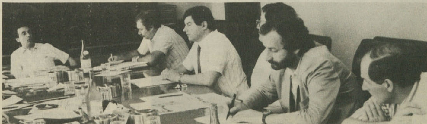
Prva seja novoizvoljene deželne svetovalske skupine KPI