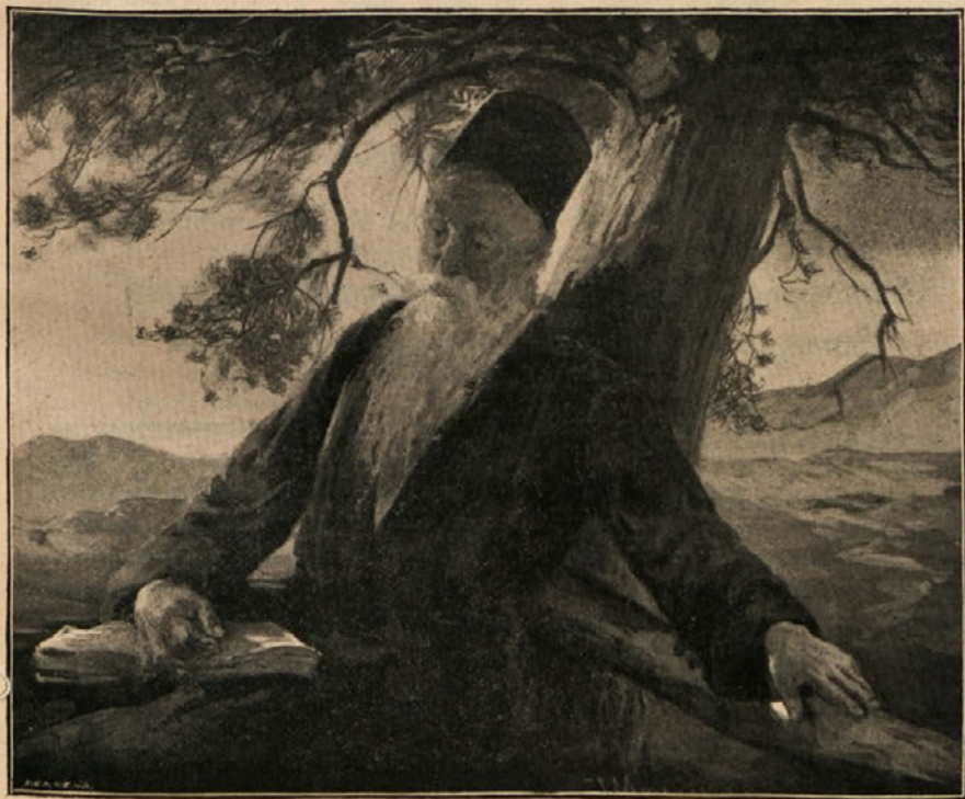
Отець Паисий. (Картина на И. Мърквичка).

е обнародвана въ ръкописъ. Списанието на отца Паисия отъ научна страна нѣма твърдѣ голѣма цѣна; нѣ ний нѣмаме никакво право да искаме отъ него строга историческа критика. До негово врѣме Българската история не е била почекнжта: памѣтниците ѝ сж били още разсеѣени по безчисленно множество книги, все на чужди езици. Загубеното и потлачено състояние на българската народност, ревностъ и жалостъ по рода своего, — това сж подбужденията на отца Паисия. Съживѣвание повѣнжлитѣ народни чувства у Българетѣ, съживѣвание българската народностъ — това му е цѣльта. Отець Паисий доста подробно излага славното минжло на българский народъ, и чрѣзъ това изложение се старае да вдѣхне нравственна сила въ съврѣменнитѣ му Българе. Съ разни наставления, съ доказателства, а понѣкога и съ строго укоряване се е старалъ той да свѣсти всички загубени Българе, или както ги нарича той — отцегугатели „О неразумне и юроде!“ казва той въ прѣдисловието си на отцегугателитѣ: „поради что се срамишъ да се наречешъ Българинъ? Или не сж имали Българе царство и господарство? . . . Но отъ что се ти, неразумне, срамишъ отъ свой родъ и влачишъ се на чужди езикъ?“