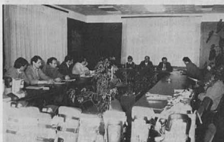
Delavski svet delovne organizacije