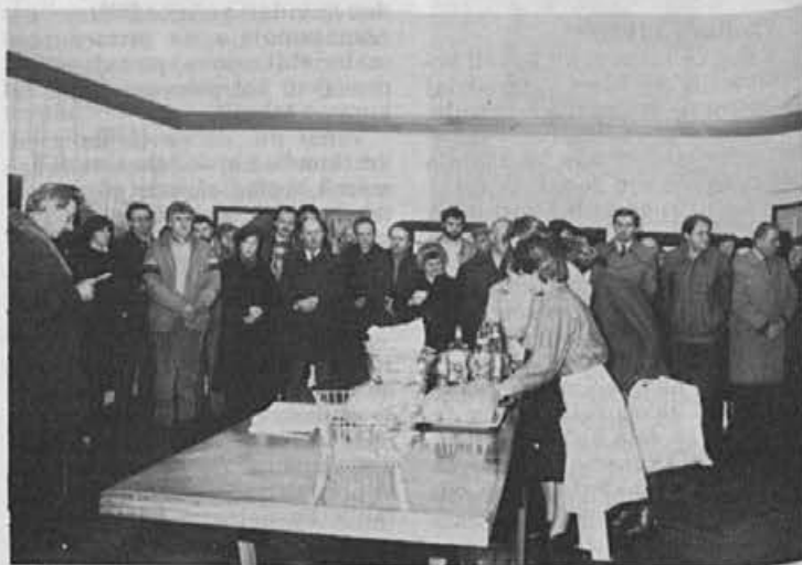
Ob prenovitvi prostorov DPD Svoboda Žiri so odprli tudi slikarsko razstavo amaterskih likovnih ustvarjalcev naše občine, na kateri je razstavilo svoja dela 12 slikarjev.

Za njegovo delo mu bomo ostali hvaležni.