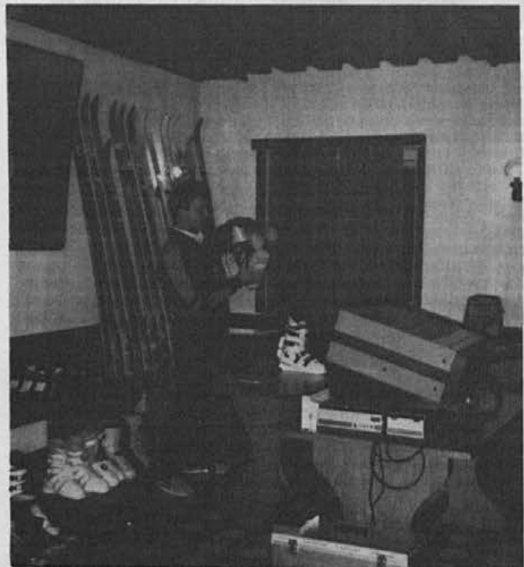
Ena pomembnih akcij, ki prispeva k boljši prodaji je tudi usposabljanje prodajalcev