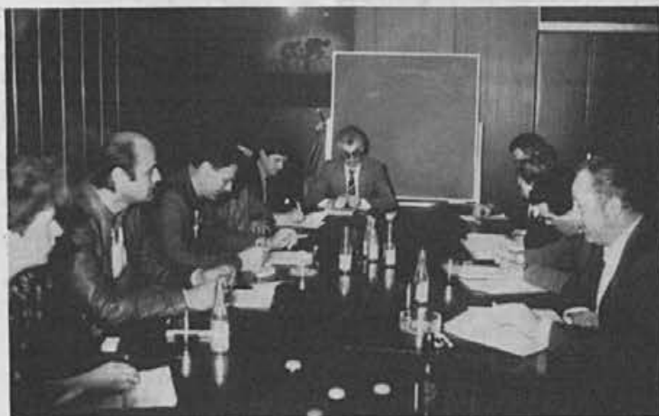
Delavski svet TOZD Prodaja