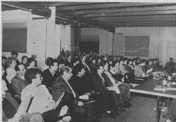
Razprava na poslovodski konferenci je bila letos manj ži- vahna kot običajno

Ce strnem: ti in še drugi odgo- vori so si včasih nasprotujoči po posameznih željah. Toda eno je nesporno — delamo zato, da za- služimo; naš cilj pa mora biti obutev prodati.