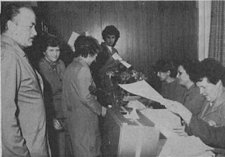
13. marca smo volili delegate za zbor združenega dela občinske skupščine.