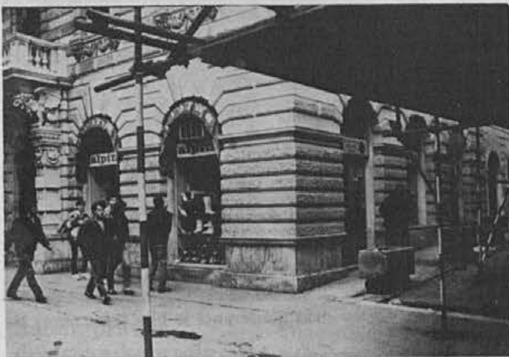
Zunanost prodajalne na Reki

»Prodajalna je odprta šele te dni, vendar mislim, da bo sčasoma postala dobra prodajalna, čeprav ni v centru. Potrebna pa bo reklama in dobro delo.«