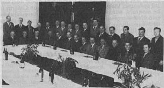
40 let pozneje — prvi vajenci Alpine

Vendar pa menim, da bomo vprašanje zalog rešili le na ta način, da se dela načrtno lotimo in material skušamo porabiti; če pa ne, pa je material bolje odprodati po ugodni ceni.