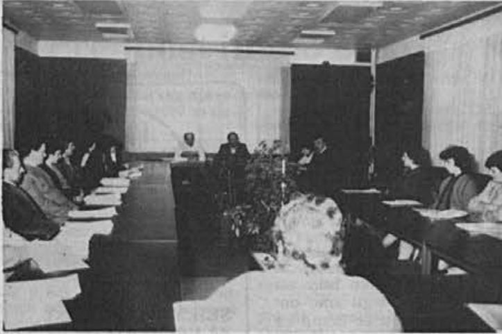
Delavski svet TOZD Proizvodnja