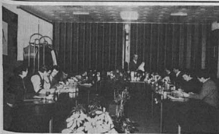
Tudi z grosisti se je treba pogovoriti in predstaviti naše izdelke

tev. Prav tako so planirane radijske reklame za te izdelke. Posebne akcije se načrtujejo še za sezonska znižanja.