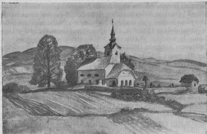
Griblje: Cerkev sv. Vida

Kot šestnajstletno dekle je začela delati po polju z motiko in srpom. Le včasih je bilo vsakdanje delo in monotono življenje prekinjeno s pohodom k maši in v vinograd na Plešivici, kjer imajo Gribeljci svoje zidanice. Pri kopanju in prašenju spomladi in na jesen ob trgatvi se je pelo in vriskalo, da je gora zvonila in