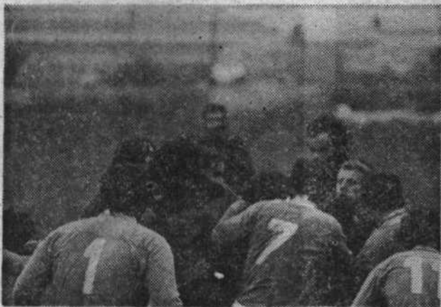
S finalne rugby tekme med Šiško in Bežigradom