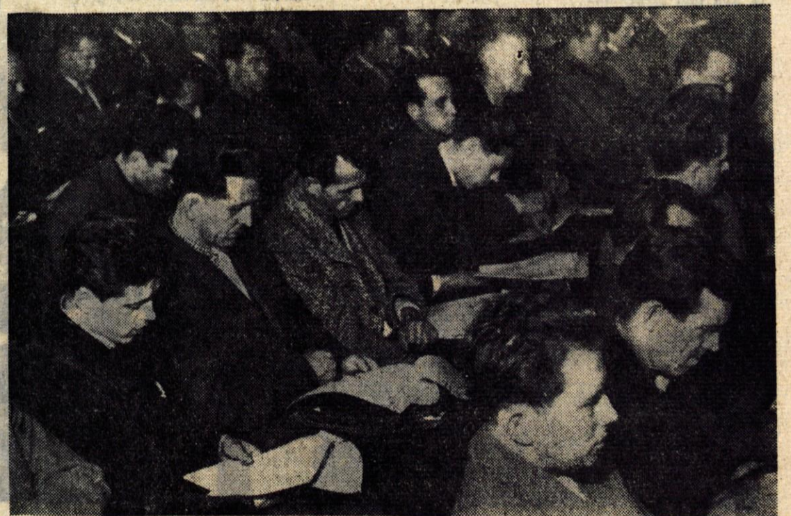
Včeraj je bila v Trzinu občinska konferenca Zveze komunistov