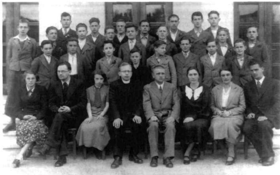
Prvi absolventi (4. letnik) Meščanske Šole v Škofji Loki leta 1936