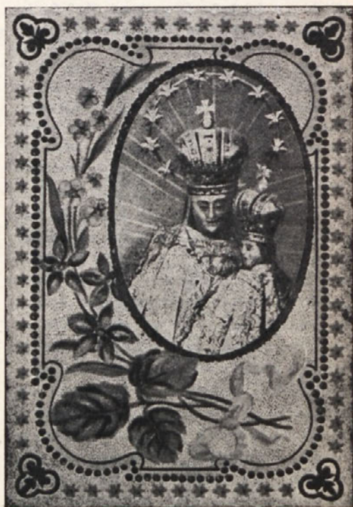
Milostna podoba Višarske M. B.

Velike črke v napisu nam kažejo letnico MCCCLX = 1360. Tega leta so torej našli na kraju sedanje cerkve kip Marijin, ki sto-