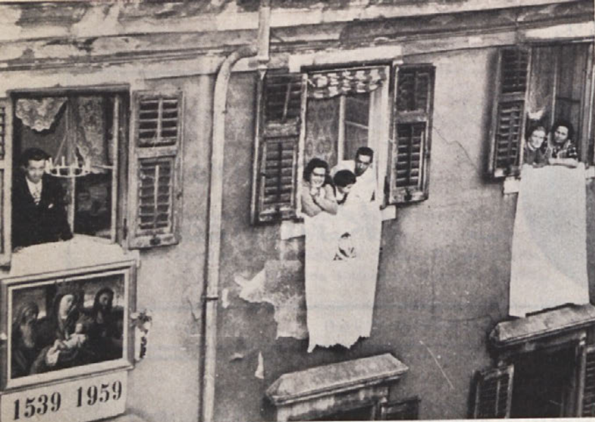
Prizor iz ulice F. Venezian v Trstu med procesijo sv. Rešnj. Telesa.

Pod oknom uredništva revije »Svetogorska Kraljica« je bila izpostavljena podoba svetogorske M. B.