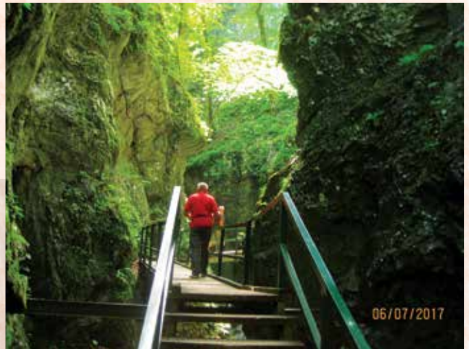
Skrad - Vražji prolaz

Ogledamo si Mužekovo hišo in zdi se nam kot da smo sami na svetu.