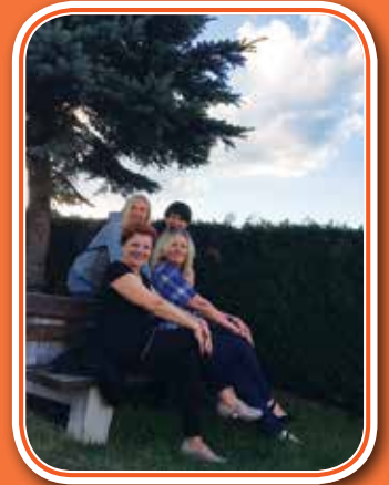
Počitek na zelenem Pohorju... v samoti ob spokojnem jezeru