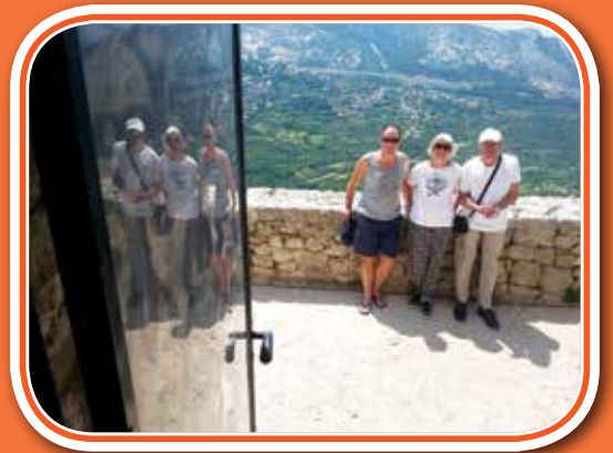
Koliko je naših na fotki?