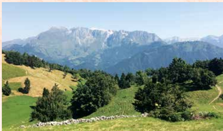
Obdajala nas je čudovita narava