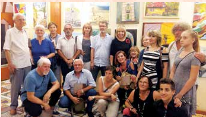
Vsi udeleženci kolonije

Čas je hitro potekal in prišla je sobota, dan razstave. Vsi smo slikali po dve sliki, otroci pa po eno. Vse se