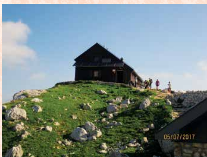
Koča na Planini pi Jezeru

Presenetljivo, ni dežja, vreme kot naročeno, mi polni elana, odprtih src in poguma, pripravljeni za vzpon do Koče na Planini pri Jezeru.