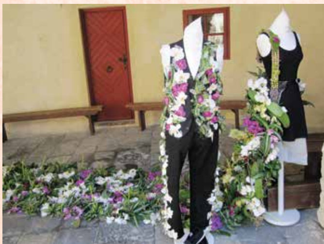
Čipka in cvetje