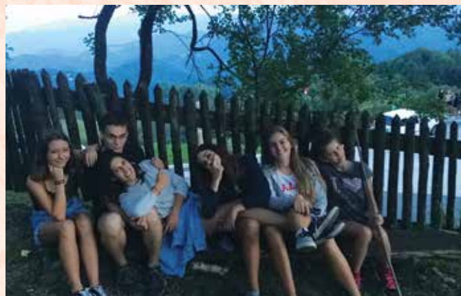
Prosti čas in veselo druženje