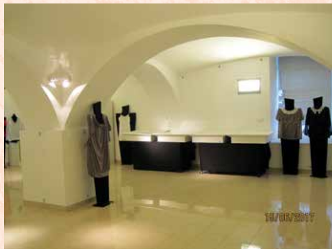
ČIPKA ZA VSE - del našega razstavnega prstora

„Poglej, kaj znam!“ 2017 - letna razstava idrijskih čipk otrok in mladih Čipkarske šole Idrija, „Domišljija, barva, črta, nitka, čipka-razstava avtorskih vzorcev in čipk“ - Čipkarska šola Idrija, „Pogrinjek za Magdaleno-Čajanka za Magdaleno“ - Društvo klekljaric idrijske čipke-skupina Dole (št. krožek),