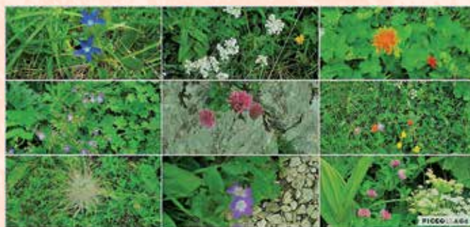
Te skromne, dišeče majhne lepoticе

Koča kot v pravljici, hišnik vesel, na hitro nam zamenja tople pločevinke Laškega za mrzle.