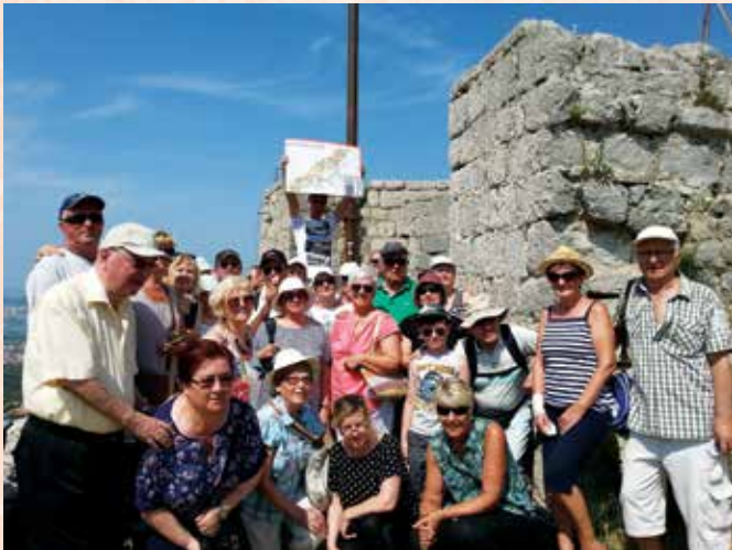
Na obzidju trdnjave

Vroč soboto, 24. junija, smo se ob osmih odpravili z avtobusom proti Klisu. Dveurni ogled trdnjave je