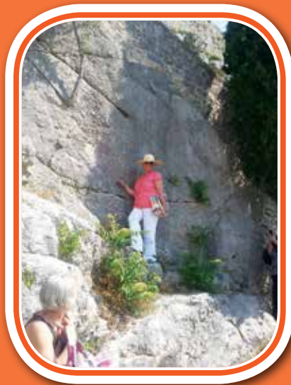
Takole nas naša vodička vodi z visoka.