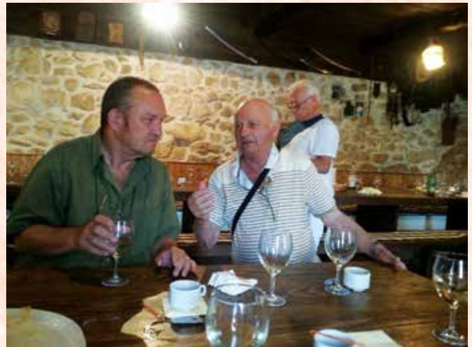
Ubrani duet v kmečkem vzdušju