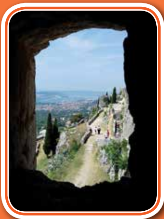
Pogled skozi okno nekdanj in... danes.