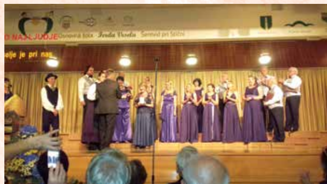
Dvajset let smo tu

Topla dobrodošlica, prisrčnost in pozornost gostiteljev, pevskega zbora »La Vita« je bivanje v teh krajih naredila nepozabnim.