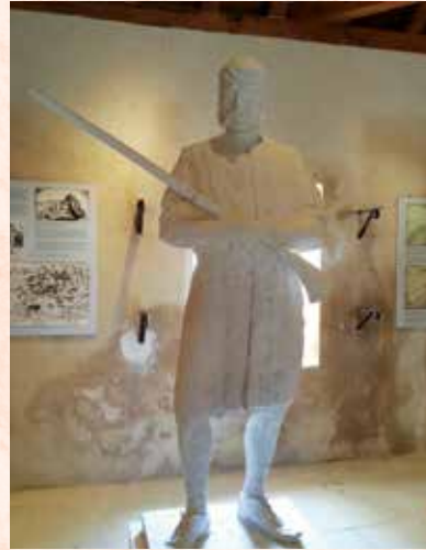
Eksponat v Uskoškem muzeju

dogajanja stoletnih bojev cele vrste civilizacij; tam od časov Rimljanov, preko Benečanov in Turkov, do Francozov in Avstrijcev, vse do konca Druge svetovne vojne, po kateri trdnjava gubi svoj vojaški strateški pomen.