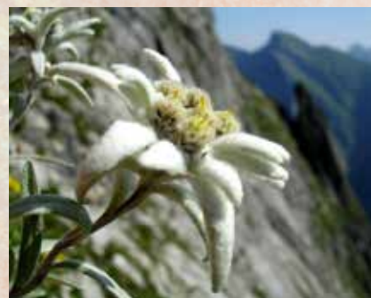
Planika ali očnica, prva z zakonom zavarovana rastlina v Sloveniji

Planika je v večini držav zavarovana rastlinska vrsta, v Sloveniji že od 1898.