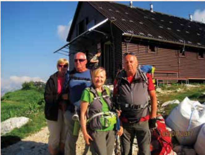
Zasavska koča na Prehodavcih