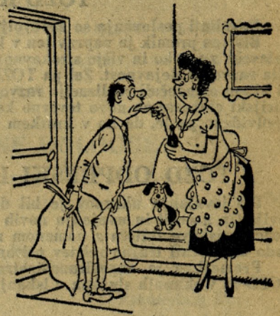
Če bo Fifi videl, da ti je všeč, bo tudi on vzel zdravilo. (KIH)