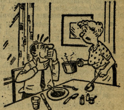
Ne pusti me čakati, takoj mi povej, ali ti je moja zelenjavna juha všeč! (KIH)