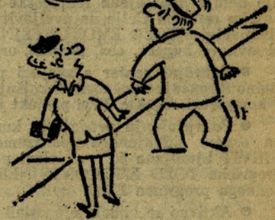
Pojdiva no, saj boš lahko jutri bral v časopisu! (KIH)