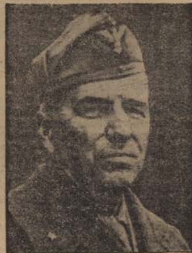
Neuer Stabschef des italienischen Heeres. Armee general Vittorio Ambrosio übernahm das Amt des Stabschefs des Heeres

Dne 29. julija 1921 je zbor nacionalsocialistične delavske stranke izvolil Hitlerja za svojega prvega predsednika. Takoj nato se je stranka, ki se je do takrat vodila tovariško in je odloke sklepala s parlamentarno večino glasov, preoblikovala v pokret, ki je slonel na sistemu voditeljev. Max Amann, frontni tovariš in Feldwebel v polku, kjer je služil Führer, je prevzel vodstvo administrativnih in tiskovnih del stranke.