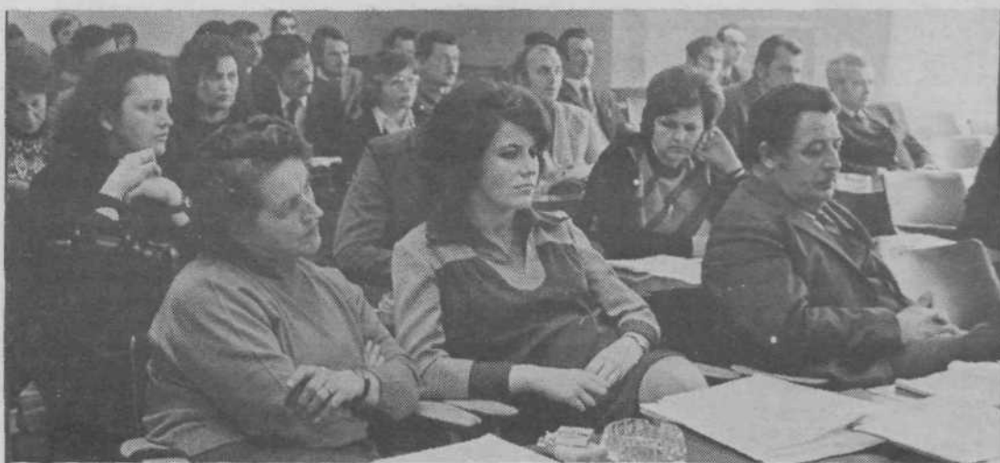
Prva seja zdravstvene SIS