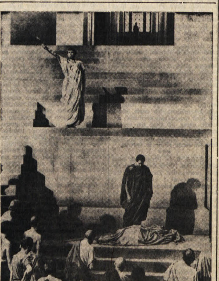
V kratkem bodo italijanski kinematografi vrteli nov film družbe MGM «Julij Cezar» po istoimenski Shakespearovi tragediji.

Do sedaj ni o Degrellu ne duha ne sluha. Pravijo, da je sedaj nekje v bližini Malage na slovi obali «Costa de sol».