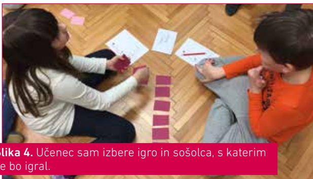
Slika 4. Učenec sam izbere igro in sošolca, s katerim se bo igral.

Uvedli smo tudi SUPER PONEDELJEK. Z učenci smo ugotovili, da je ponedeljek zelo naporen zaradi zahtevnega urnika in vseh drugih dejavnosti, pa še ponedeljek je. Skupaj smo iskali rešitve, kako bi si dan naredili prijetnejši. Upoštevala sem predloge učencev, ki so predlagali naslednje dejavnosti: Pri slovenščini sem učencem vsak ponedeljek brala zgodbo v nadaljevanju. Pri matematiki so utrjevali znanje ob didaktičnih igrah (igro in sošolce za igro so si izbirali sami). Pri spoznavanju okolja smo si ogledali kakšen poučen film in se ob tem pogovorili ali izdelali miselni vzorec. Pri športu so dejavnost predlagali sami. Izbrali smo tisto, ki jo je predlagala večina otrok. Pri glasbeni umetnosti smo peli in plesali. Ponedeljek je tako postal najbolj priljubljen dan v tednu, učenci pa so bili zadovoljni tudi zato, ker so bile upoštewane njihove želje.