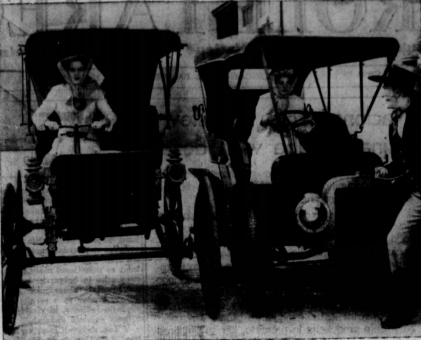
Na gornji sliki so avti, kakor jih je ta takrat še nova, industrija producirala v početku. Vsem so se zdeli luksusi. Milijone ljudi, ki so se preživljali s konjsko vprego, z železnico in električnimi progami, so jih smatrali za nebodiljtreba. Pa se je primerilo, da je postal avto Američanu v tovoru in osebnem prometu potreba. Sedaj pa se ji mora stopnjema odrekati, ker preti valed vojne občutno pomanjkanje gumiya.

Ako socializem nima bodočnosti, čemu se ga plutokracija tako boji?