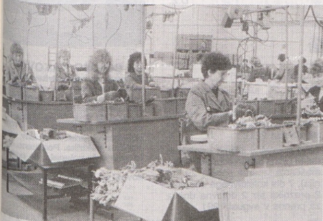
Od 1. julija 1991 naprej delavke v dosedanjem žičnem oddelku Pralno-pomivalne tehnike Gorenja Gospodinjski aparati delajo v novem podjetju Gorenje IPC.