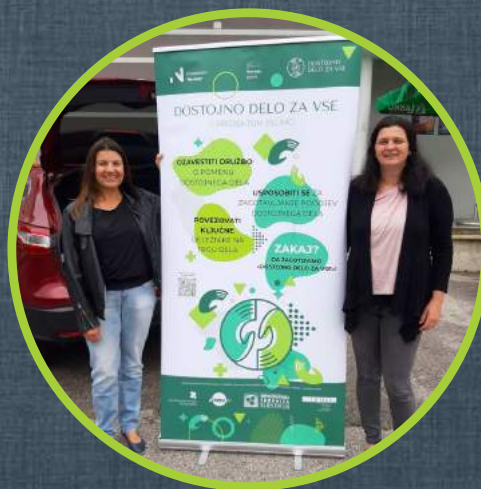
Dostojno delo za vse

Na Zavodu za zaposlovanje smo zasledili razpis za prijavo projektov na temo Dostojnega dela. Tema je zelo aktualna in zavedanje o tem, kaj je dostojno delo zelo pomembno, zato smo se odločili, da prijavimo projekt. K sodelovanju smo povabili inštitucije, za katere smo ocenili, da bi lahko skupaj pripravili projekt, ki bo zadostil pogojem razpisa. Predstavili smo jim našo idejo, ki smo jo potem uskladili in skupaj preoblikovali v projektno prijavo.