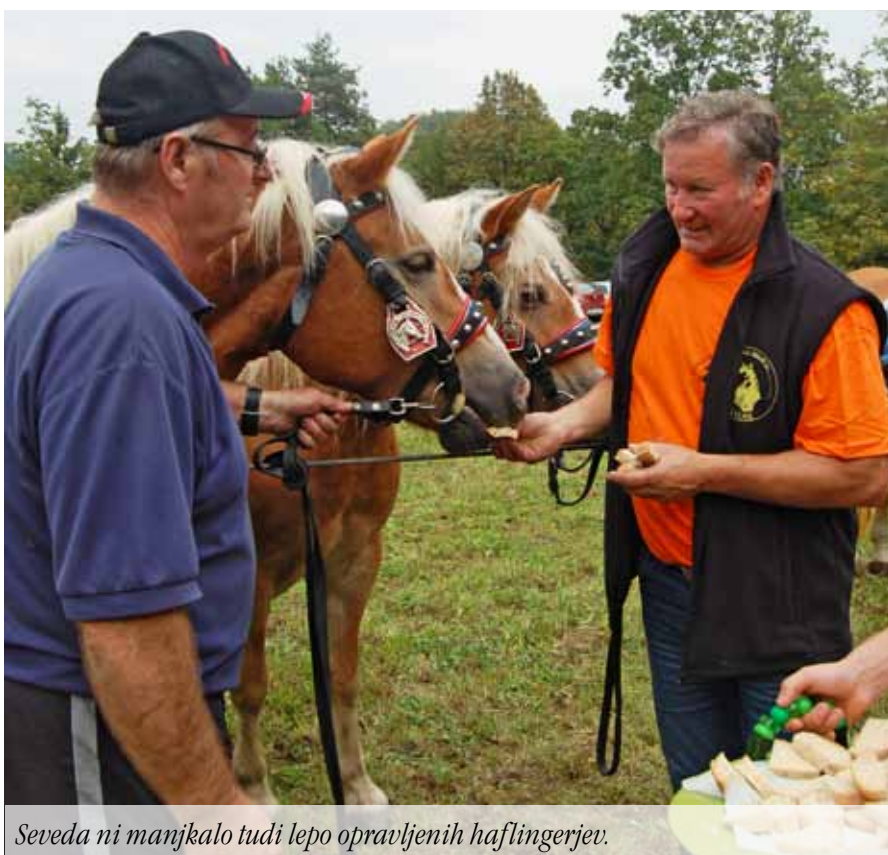
Seveda ni manjkalo tudi lepo opravljenih haflingerjev.