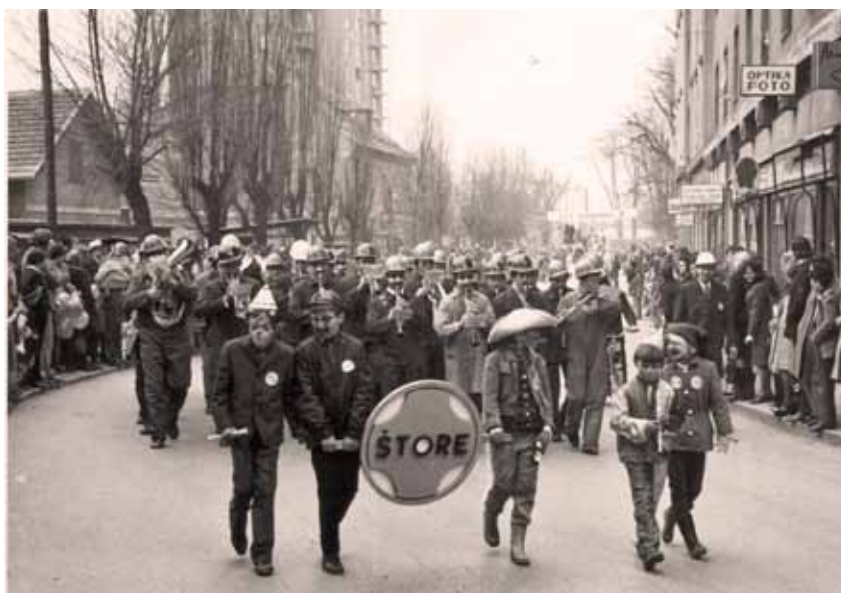
Karneval štorske godbe na pihala l. 1973 v Celju na Ljubljanski cesti