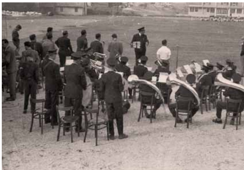
Otvoritev športnega igrišča na Lipi l. 1958 (fotografija je last godbe na pihala)