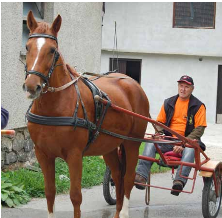
V enovprego - gig je bila vprežena štiriletna kobila.