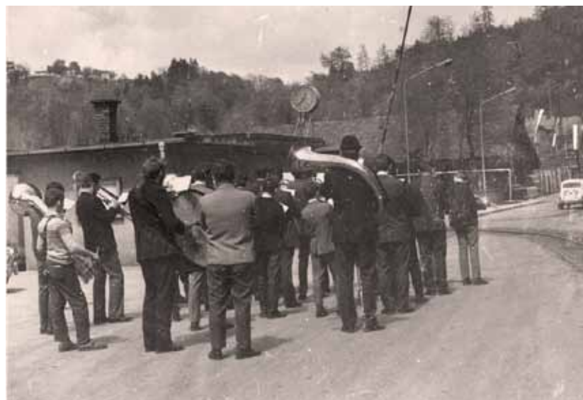
Nepozabna ura na mostu čez Voglajno l. 1970