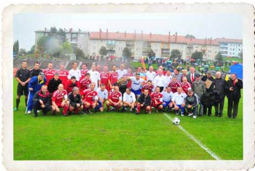
Kovinarji in Hajdukovci pred tekmo.