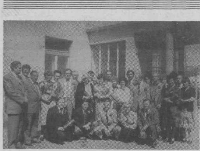
Nasmejanih obrazov so se letošnji dobitniki srebrnih znakov sindikatov odzvali fotografovemu vabilu za skupinski posnetek