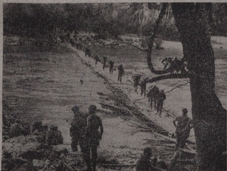
OPERACIJE ANGLO-HOLANDSKE VOJSKE NA OTOKU