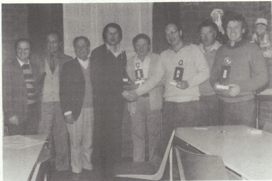
Skupina šahistov po končanih težko odigranih iger.