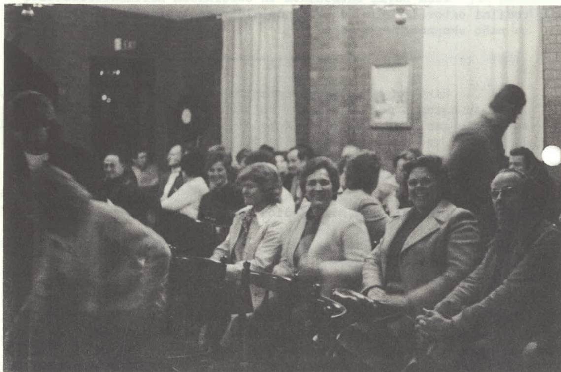
Veseli obrazi naših članov na generalni seji.