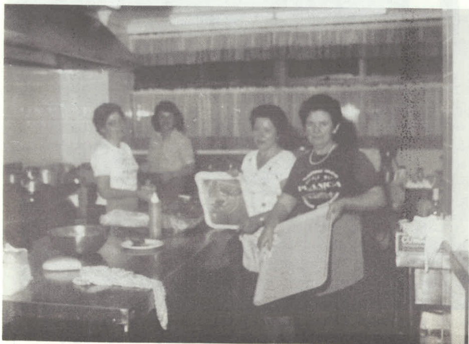
Lepa hvala materam naših lovcev ki so tako teško delale.