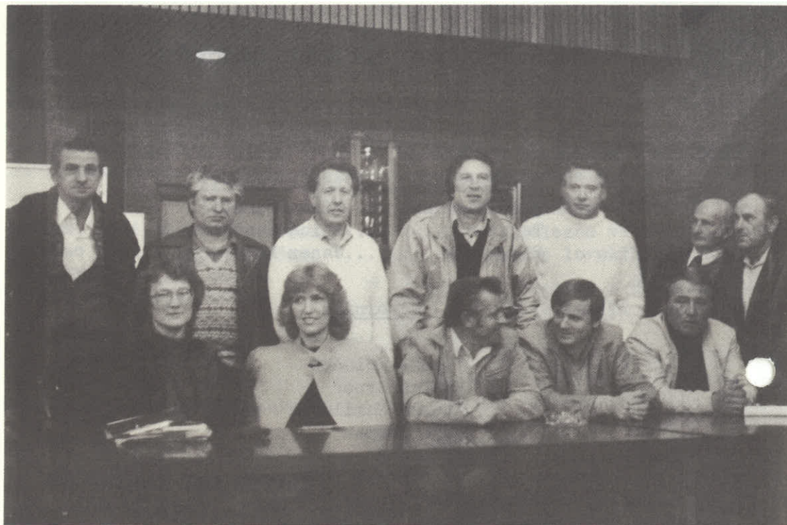
Člani odbora za leto 1984/85