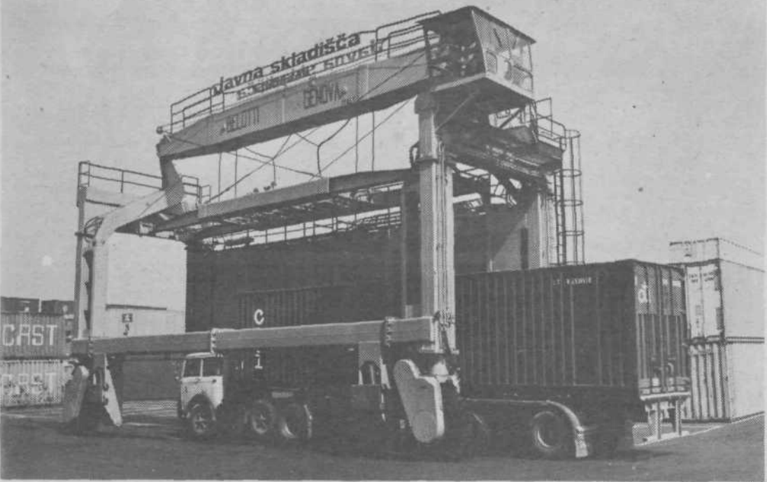
Orjaško dvigalo za prekladanje vseh vrst kontejnerjev. Za nabavo kontejnerskega terminala so delavci Javnih skladišč morali odšteti približno 5 milijonov dinarjev

Vse kaže, da si je to razmera majhno podjetje s svojimi kakovostnimi izdelki kljub izredno močni konkurenci že priborilo na jugoslovanskem trgu sloves solidnega in uglednega poslovnega partnerja.