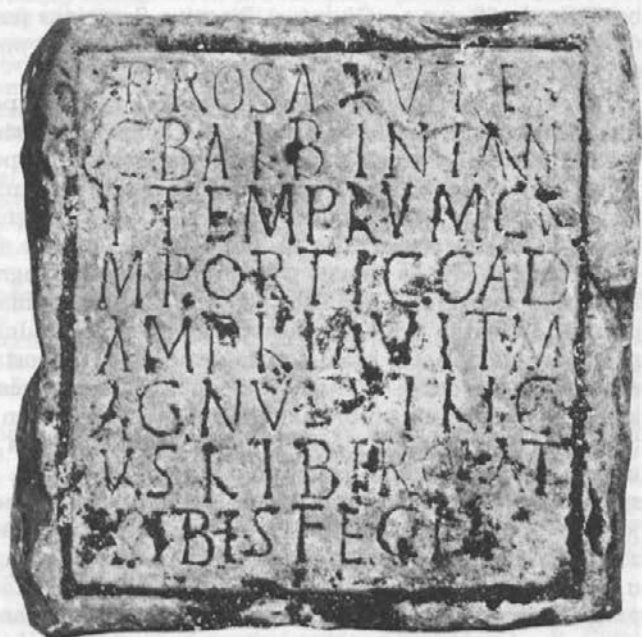
Sl. 3: Liberov natpis iz Polača – otok Mljet.