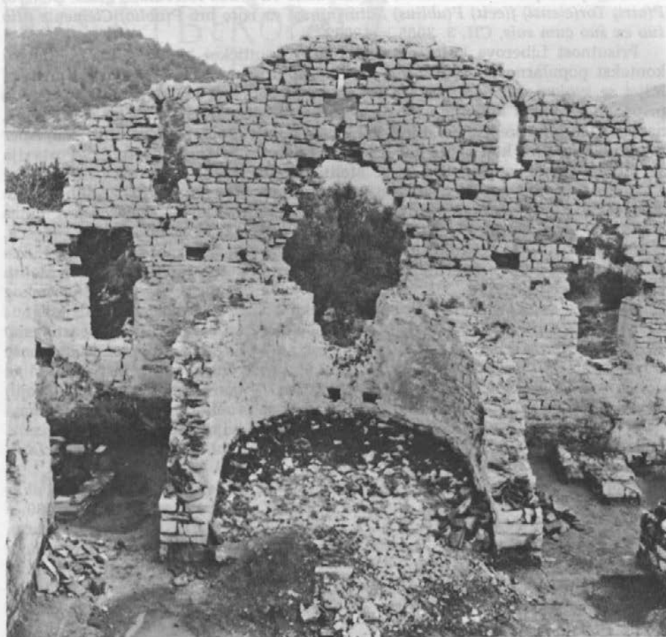
Sl. 2: Ranokršćanska bazilika u Polačama na Mljetu.

Ime – kognomen vilika Magnusa je veoma rašireno, posebno u Italiji i keltskim pokrajinama. Kod nas ih ima nekoliko u Jaderu, Saloni i Naroni. 5 Izostanak prenomena iz imenske formule našeg Balbinijana ukazuje na vrijeme druge polovine drugog stoljeća. 6 Osim toga kosa donja crta slova L bi govorila za razdoblje trećeg stoljeća. U Trpnju na susjednom poluotoku Pelješcu nađen je natpis, što sam ga objavio, gdje je donja hasta na L također koso klesana, a datirao sam ga također u to vrijeme. Ovakvo L je i u Meziji oznaka natpisa 3.–4. stoljeća. 7 Po tome bi i naš natpis bio bliži trećem stoljeću.