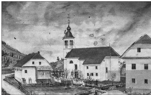
Župnijska cerkev sv. Jošta leta 1866. Cerkvi so med letoma 1873 in 1875 prizidali še dve stranski kapeli.

nedeljo popoldne naj se v ta namen molijo litanije vseh svetnikov, vernike naj se k udeležbi posebej povabi in se jih spodbuja tudi k molitvi doma, podobne prošnje pa naj se molijo tudi med rednimi mašami. 86