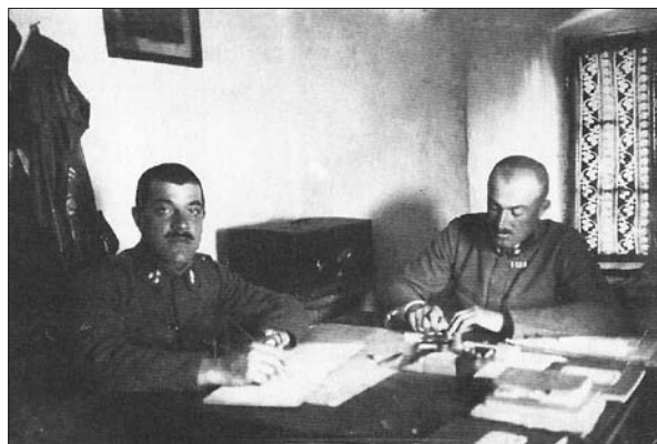
Upravnik postaje žičnice v Zadlogu.