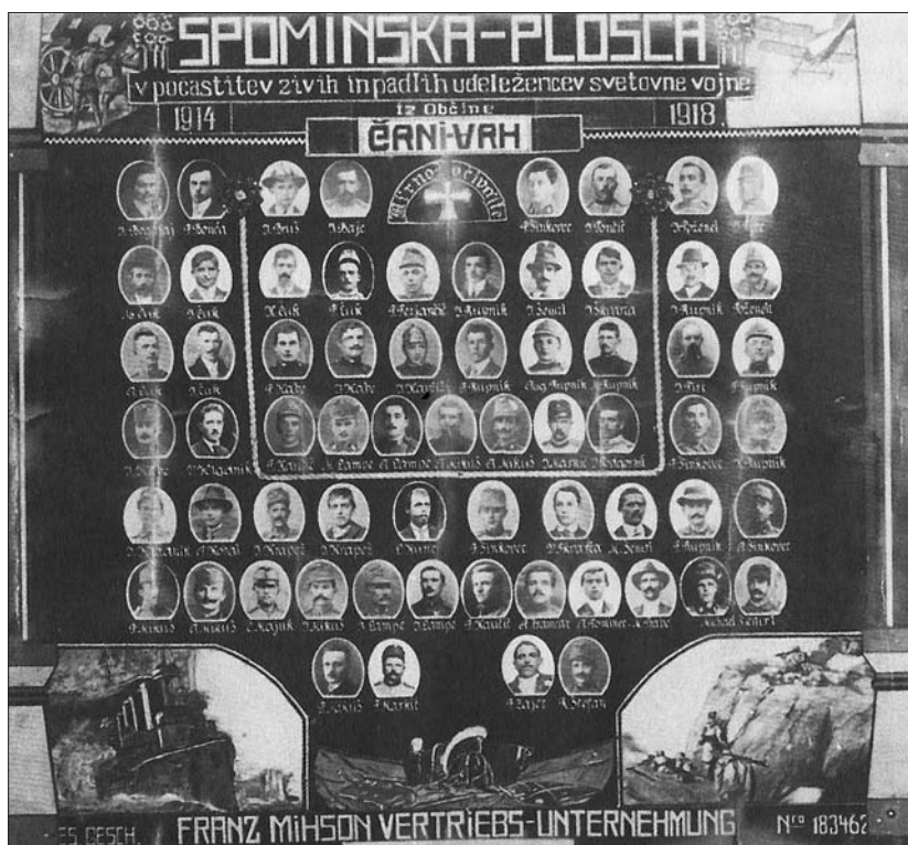
Spominska tabla mobilizirancev iz Črnega Vrha.

zatirali strah pred prihodnostjo, izražali skupnostno solidarnost ter premagovali občutke izgube ob ločitvi od svojih najdražjih. 34