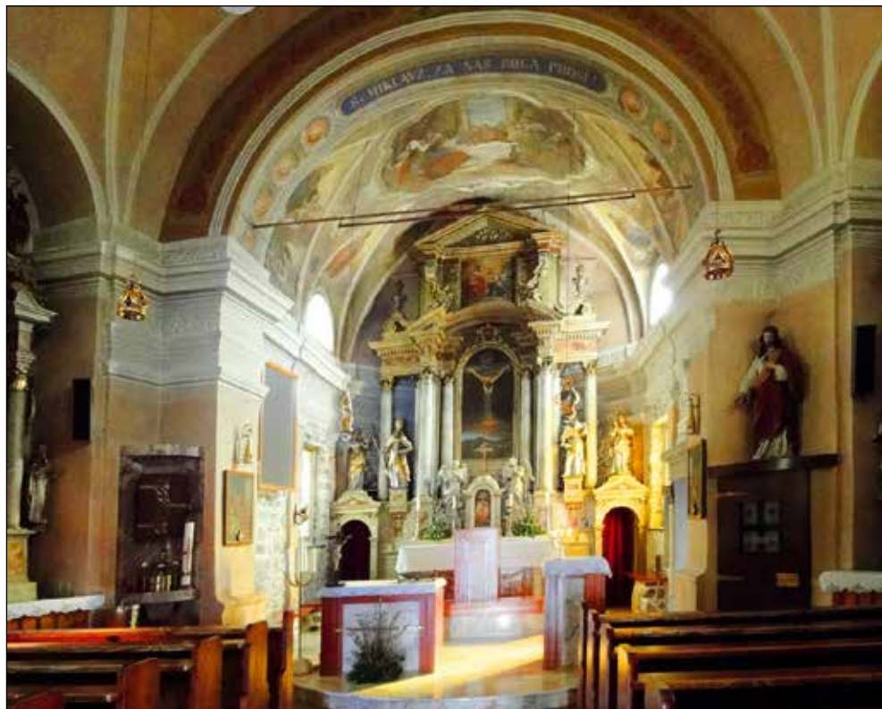
Notranjost soriške cerkve.