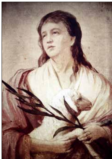
Ivan Grohar: Sv. Neža. Vir: Alojz Pintar

Na vrhu glavnega oltarja je vdrelana slika, ki predstavlja Očeta in Sina s kronanjem Device Marije v velikosti 1 x 0,5 metra neznanega avtorja. Stranski oltar ima sliko sv. Vida v velikosti 1,5 x 0,5 metra. Oba stranska oltarja imata na vrhu še eno sliko elipsaste oblike. Na levi strani je sv. Jurij, na desni pa