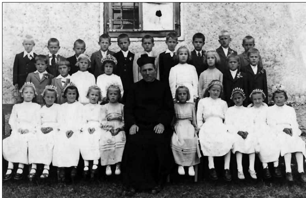
Župnik Skvarča, 1951.