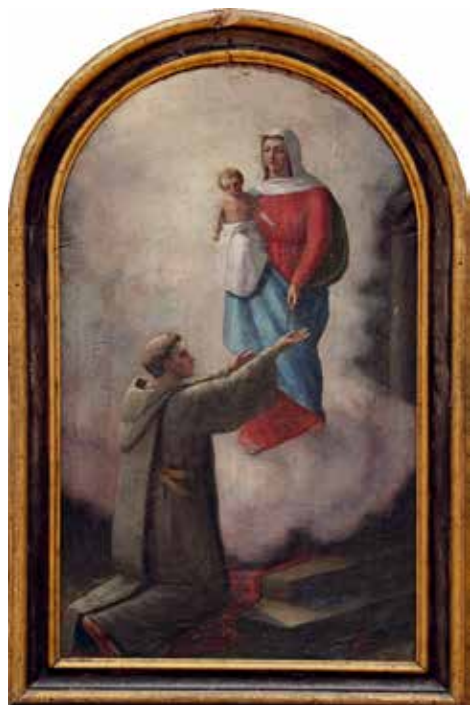
Marija s sv. Dominikom, slika za stranski oltar, Ivan Grohar, (1891), 1894.