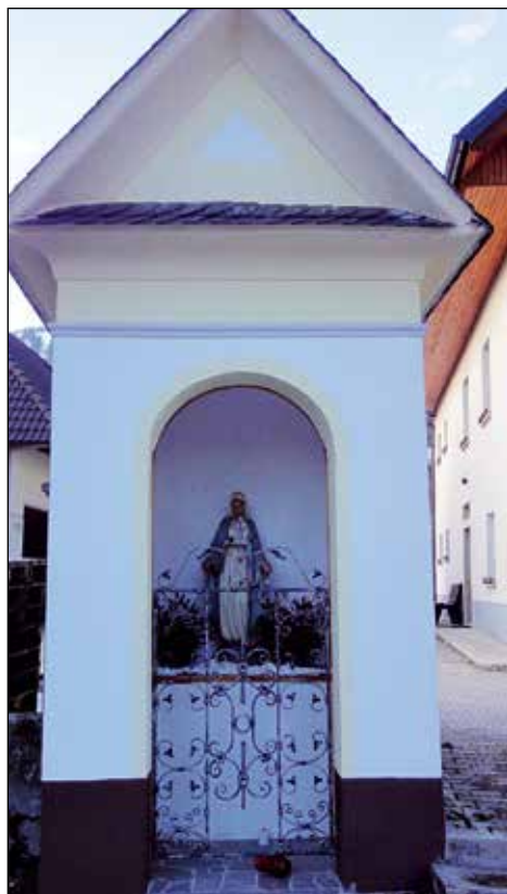
Kapelica pri cerkvi s kipom Brezmadežne.

Namen opisa je ohranitev bogate podedovane kulturne dediščine naših prednikov. Z opisom izražam spoštovanje do ljudi, njihovega dela, pokončne in trdne pripadnosti krščanskemu izročilu. Kulturna dediščina na Soriškem je posebna in edinstvena.