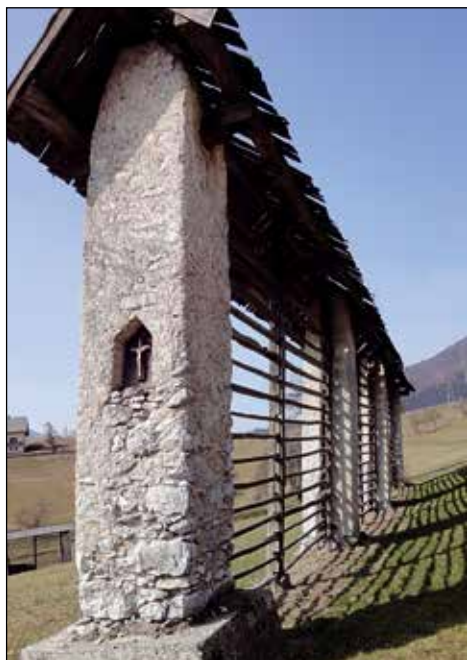
Šimanov kozolec.