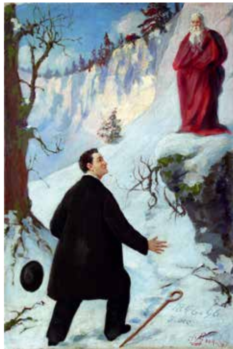
Župniku Jamniku za 50-letnico.