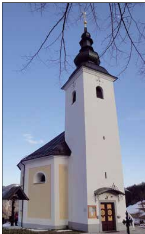
Župnijska cerkev v Sorici.

Sorica je ena izmed najlepših vasi v Selški dolini. Obdajajo jo ratitovške strmine, nad Sorico so drzni vrhovi Soriške planine, v daljavi Črna prst, Vogel. Ko se dvigneš nad Rošt, mimo kapele sv. Cirila in Metoda, se začne odpirati pogled na vasico kozolcev, skrbno urejenih domačij in kot na dlani na hribčku stoji cerkev sv. Nikolaja. Od nekdaj do danes skrbno, s toplimi rokami domačinov negovano svetišče, zatočišče nešteti prošenj, stisk in zahval.