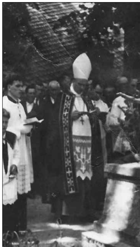
Molitev pred križem, leta 1938. Škof Gregorij Rožman.