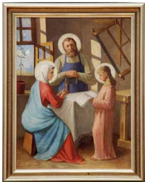
Sveta družina, Grohar, 1895. 4

V oklepaju pri nekaterih umetniških delih so tudi letnice nastanka Groharjevih del, ki sem jih našla v Nadškofijskem arhivu v Ljubljani in se ne ujemajo s podatki v zapisnikih o stanju slik Restavratorskega centra v Ljubljani. Nastanek slik je bil ugotovljen v Restavratorskem centru. Po navadi je na teh umetniških delih letnica na hrbtni strani.