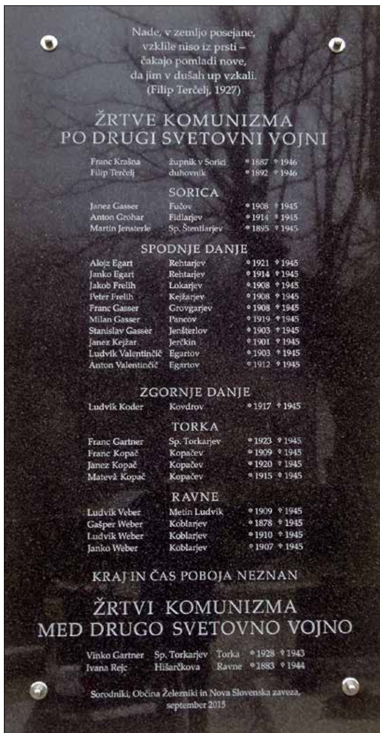
Spominska plošča na župnijski cerkvi v Sorici.