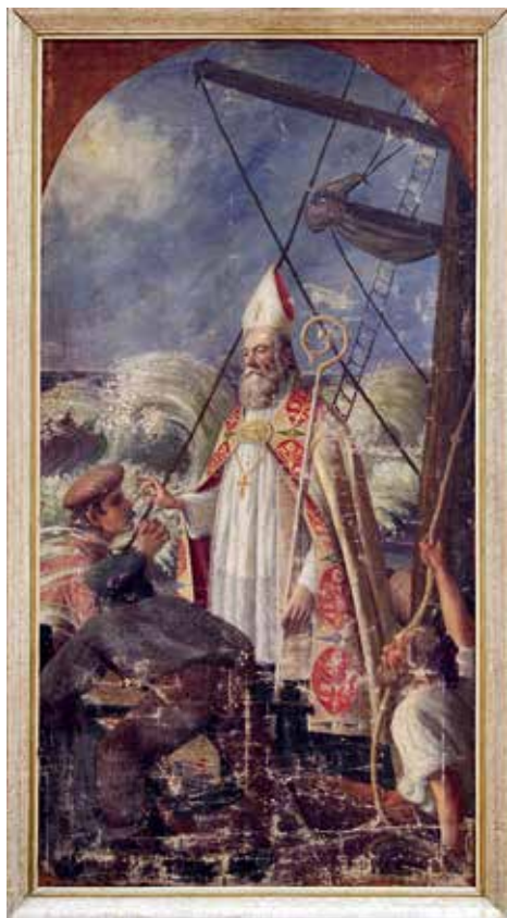
Sv. Nikolaj (Miklavž), slika za glavni oltar, Ivan Grohar, (1898), 1896.