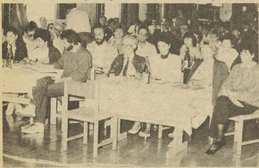
Kakšnih 230 novinarjev in organizatorjev obveščanja v združenem delu se je zbralo na svojem 7. strokovnem srečanju na Rogli

Oba govornika sta močno podčrtala odgovornost virov informacij za njihovo vsebino in pravočasno dostopnost. Ustava in zakon o združenem delu zelo jasno določajo, da so nosilci javnih funkcij – tudi vsi delavci s posebnimi pooblastili in vodje strokovnih služb – dolžni obveščati svoje kolektive o vsem, kar je za kolektiv pomembno in kar pomeni njihovo delo kot vir podat-