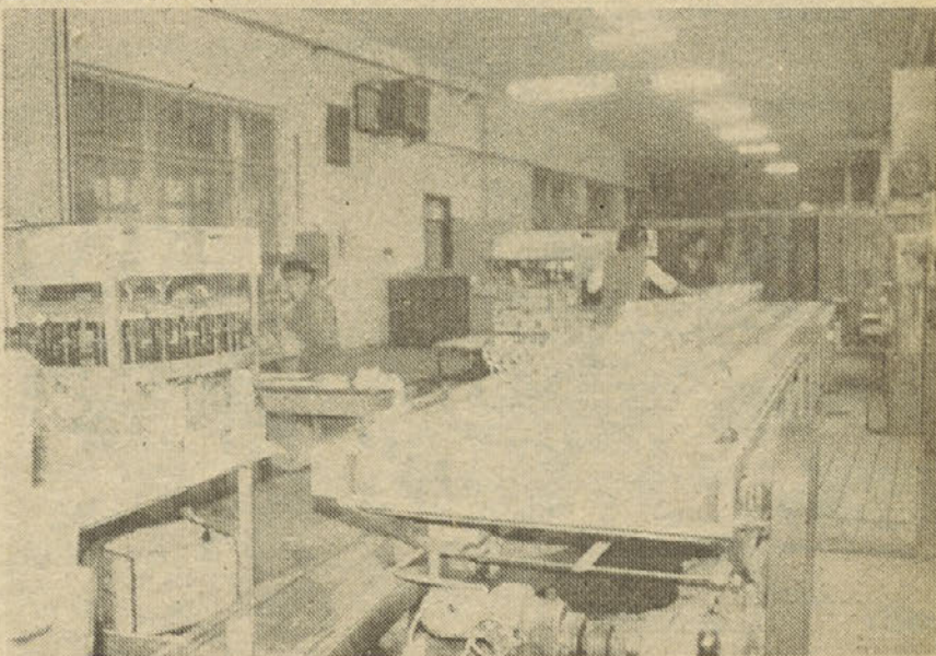
Zaokrožena linija Dodelave v novih prostorih stare brusilnice

Da bi si mogli boljše predstaviti, kakšen je obseg takih del, naj pripiše-