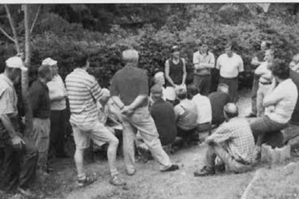
Pozorno smo poslušali strokovne nasvete strokovnjakov.

cialnimi maticami, ki jih lahko dobimo po približno 2.500 tolarjev, te stanejo kar 5.000 tolarjev.