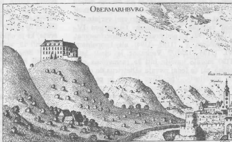
Pogled na grad Zgornji Maribor in na severozahodni kot mesta (G. M. Vischer, Topographia Ducatus Stiriae, 1681)

Kje se je razvila nova naselbina, imenovana po mariborskem gradu? Vsekakor ne tik pod samo trdnjavo, kar je izključeval že teren sam, ki je bil predvsem na jugozahodnem območju pod njim močno močvirjen, kot tudi dejstvo, da se je na južni strani pod trdnjavo razvila kasnejša grajska pristava (curia), katere zasnova sta bili že omenjeni šentpavelski kmetiji, ki sta prišli leta 1211 definitivno v roke deželnega kneza. 19 Nova naselbina je stala vsekakor že v prvi polovici 12. stoletja ter je kmalu postala upravno in gospodarsko središče obsežnega deželno-knežjega urada z deželskim sodiščem, ki je na severu segalo do Mure, na jugu pa do Drave, z obsežno posestjo, ki je okoli 1230 premogla 640 kmetij v 63 vaseh in številna gorskopravna zemljišča, ter je bila raztresena od Mure do razvodja Savinje in od avstrijske meje do Vurbeka in tja preko Lenarta v Slovenskih goricah. 1182 se imenuje »preprositura Marburc«, 1207 njen upravitelj Markvard (Marquardus de Boseth, prepositus