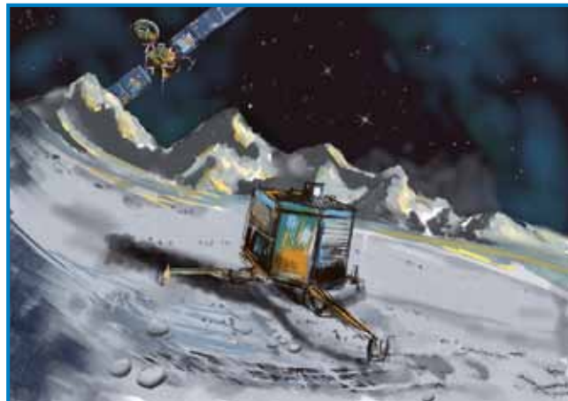
Tako nekako naj bi izgledal robot Philae, ki ga je leta 2014 na komet Čurjumov-Gerasimenko poslala vesoljska sonda Rosetta – »možgane« naprave so sprogramirali madžarski inženirji

Še bolj prepoznavna je bila madžarska udeležba pri kon-