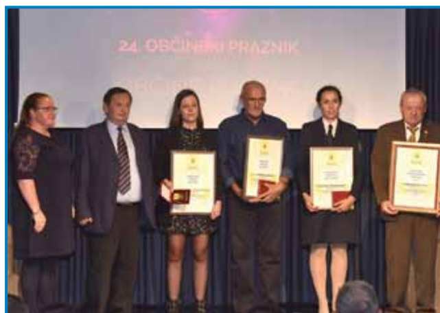
Župan na lanski proslavi občinskoga svetka vküper z dobitniki občinskih nagrad

cajta je tau ške bila fabrika peska in je spadala pod firmo iz Ruš. 1994. leta, gda so se začnole ustanavlati nauve občine, sam šau k direktori pa sam njemi pravo, ka