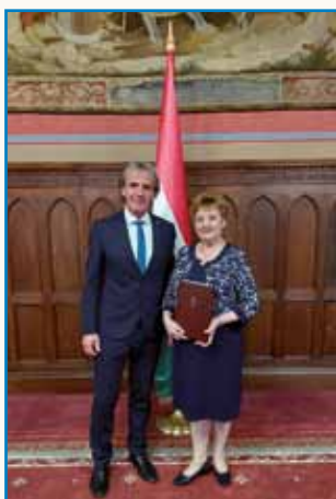
Ustanovna seja Parlamenta ... stran 2