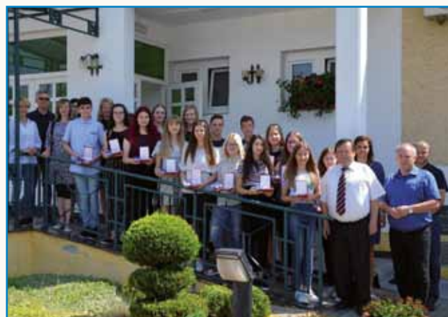
Največ pajdašov ma v Sakalovcaj stran 4