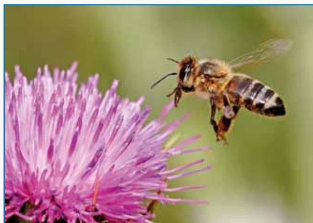
Pazi na čebele kot na zenico svojega očesa! stran 6