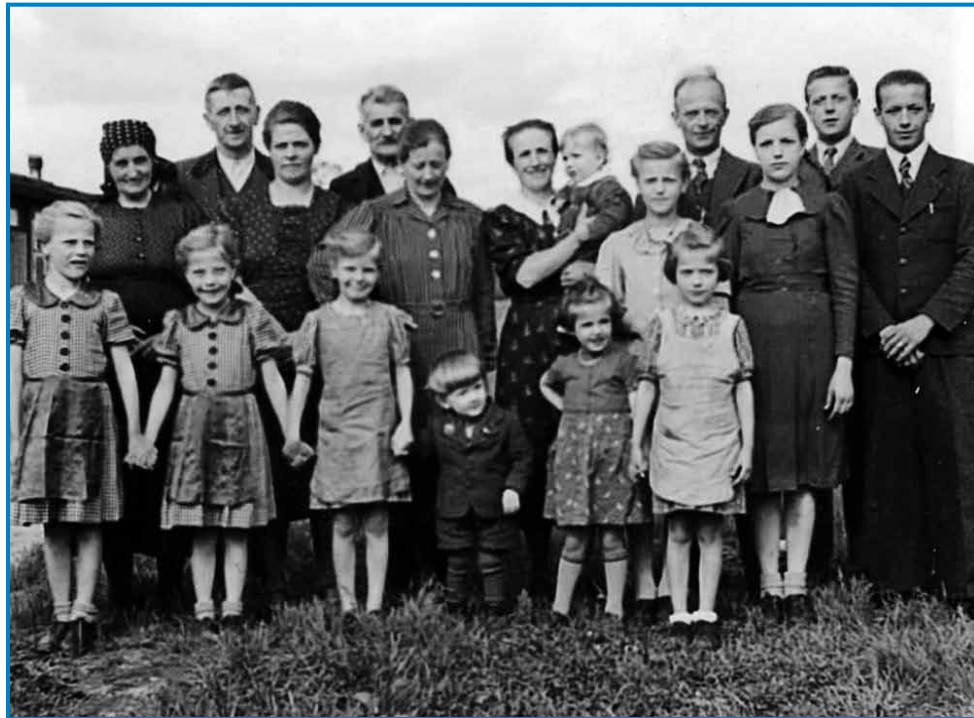
Tri vödpelane koroške slovenske držine v lageri Frauenaaurach (pauleg Nürnbergga v Dajčlandi)

dojobladali, so želejli vözagnati 220-260 gezero Slovencev (tau se jim je k sreči nej priškalo).