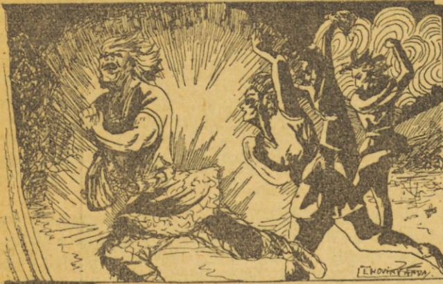
Los hunos bailando . . .

de los dirigentes, ésta es la voluntad del ejército. ¡Habla, Iztok!