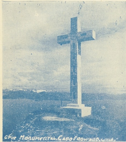
En ésta cruz se inspiró la cruz del templete en la plaza Eucarística de Punta Arenas.