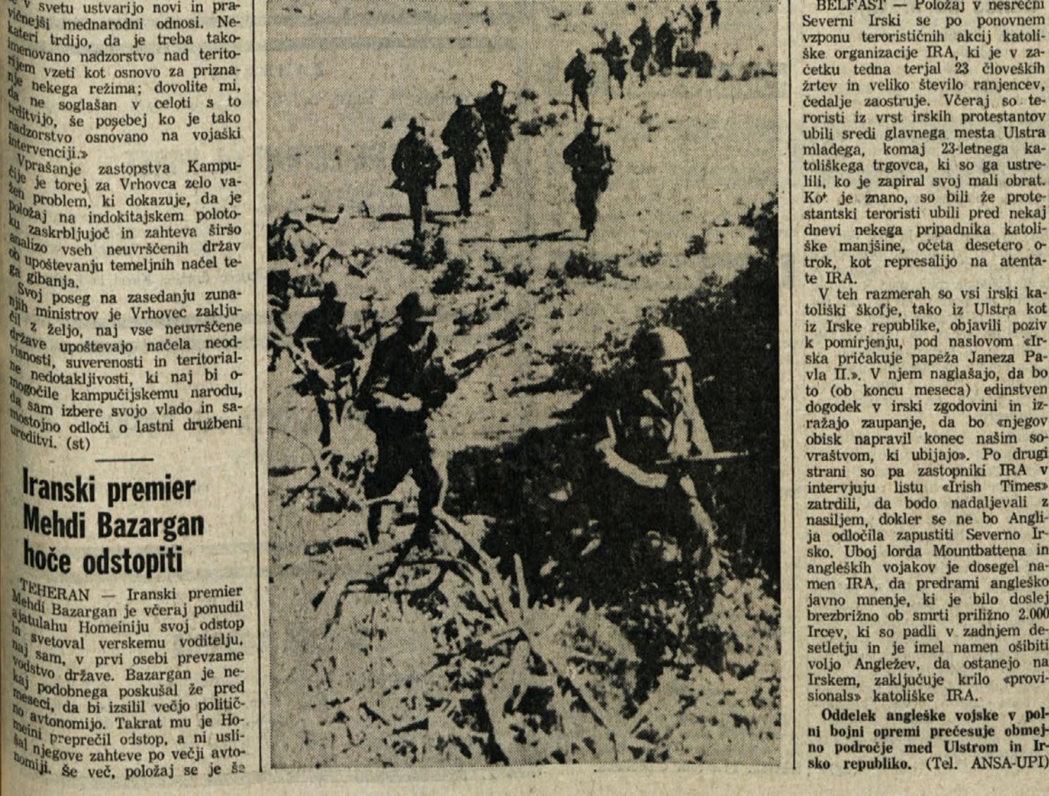
BELFAST — Položaj v nesrečni Severni Irski se po ponovnem vzponu terorističnih akcij katoliške organizacije IRA, ki je v začetku tedna terjal 23 človeških žrtev in veliko število ranjenec, nadaljuje. Včeraj so teroristi iz vrst irskih protestantov ubili sredi glavnega mesta Ulstra mladega, komaj 23-letnega katoliškega trgovca, ki so ga ustrelili, ko je zapiral svoj mali obrat. Ko je znano, so bili že protestantski teroristi ubili pred nekaj dnevi nekega pripadnika katoliške manjšine, očeta desetoro otrok, kot represalijo na atentate IRA.