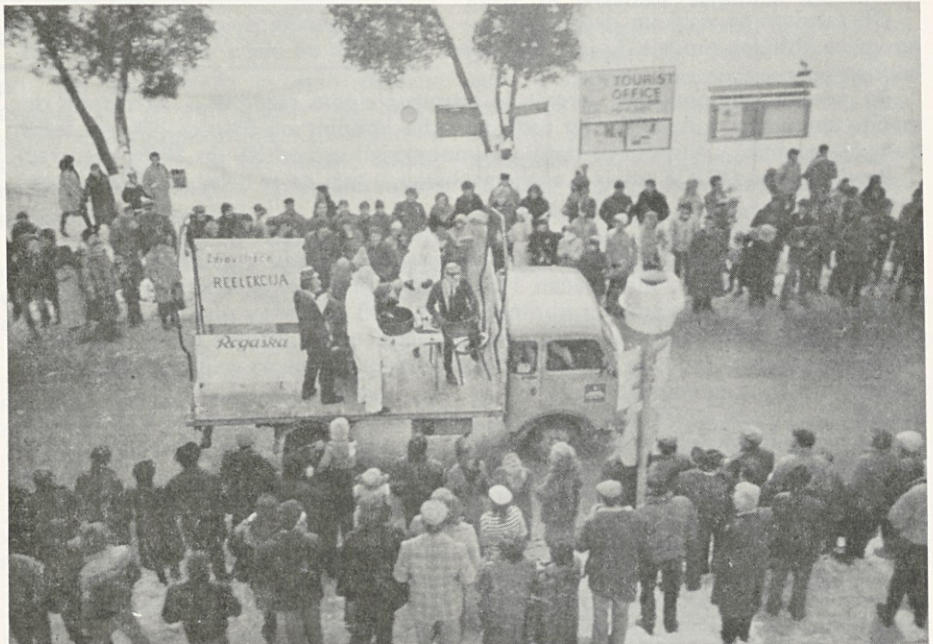
Reelekcija po karnevalsko (zdraviliška skupina)