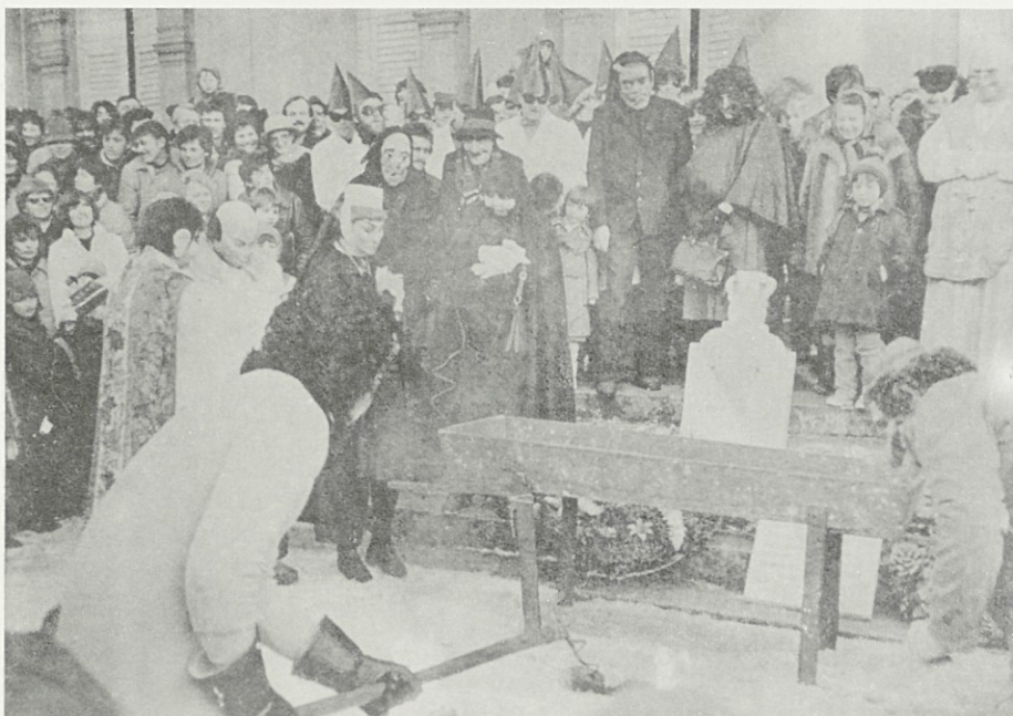
Kaznovani so grešniki . . . grehi so ostali.