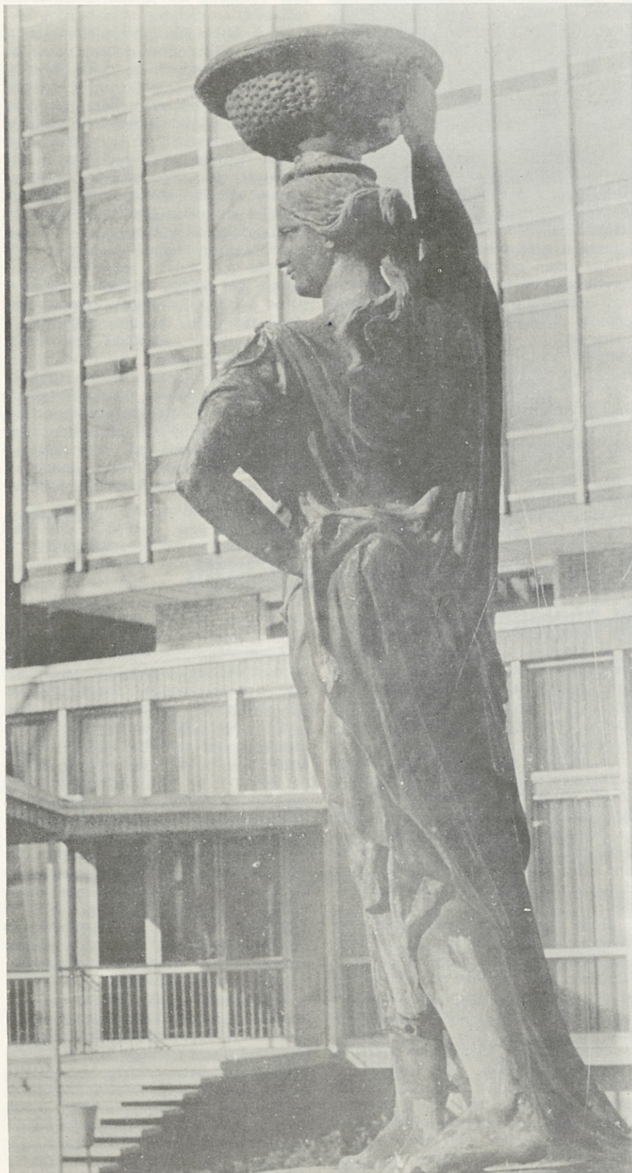
VSEM DRAGIM SODELAVKAM ISKRENE ČESTITKE K PRAZNIKU