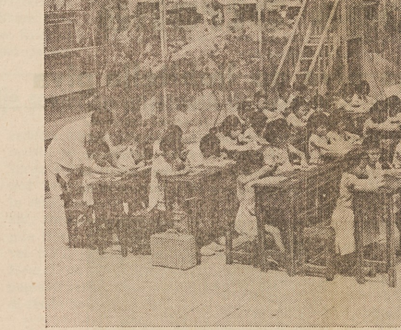
SOLA NA PROSTEM IZ POTREBE — Če je lep in ne prevroč dan, je šola na prostem čisto prijetna, drugače je seveda ob slabem vremenu. V Hong Kongu vse to vedo, pa si ne morejo pomagati, ker nimajo dovolj učilnic pod streho.

Narodni svet koroških Slovencev (NSKS) se nagiba k samostojnemu nastopanju. Druga slovenska politična organizacija, socialistično usmerjena in tradiciji nekdanje OF zvesta Zveza slovenskih organizacij (ZSO) pa vztrajno zagovarja, naj se koroški Slovenci vključijo v socialistično stranko, češ da ne smejo ostati izolirani od avstrijske družbe.