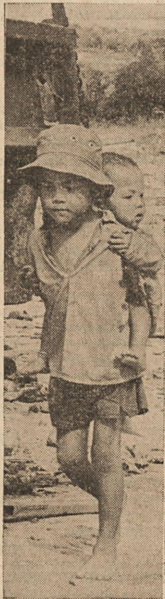
OJ TA VOJNA! — Fantič nese svojega bratca z nevarnega področja pri mestu Quang Tri, kjer se vrše hudi boji med rdečimi in vladnimi silami.

PRIPRAVLJENA ZA SKOK — Izraelske oborožene sile vežbajo za odskoke iz letal tudi dekleta, toda le prostovoljke. Na sliki vidimo tako prostovoljko, ki jo pripravljajo v padalsko opremo (na desni) in ko gleda iz letala pokrajino pod seboj, predno se bo pognala v globino.