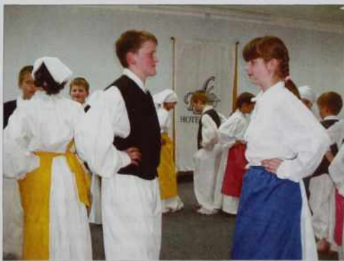
Mala senička folklor

»Veseli smo pa ponosni, ka gnes že mamo štiri mlašeče pa eno mladinsko kulturno skupino v domanji šaulaj. Tau so tri folklorne skupine, lutkovna skupina pa Mlado porabsko gledališče dijakov osemletne gimnazije. Zvojn skupin mamo glasbeno šaulo na seničkoj šauli. Za potrejbne pogoje se pobriga Slovenska zveza. In tau z veltjim veseldjom. Vej pa ranč od tej mlajšov leko čakamo, ka kak vözraščena mladina do tadale gora držali slovensko kulturo in domanjo rejč. Ranč zatau majo odgovorno delo vse lerece, školnictje, steri včijo te mlajše, vej pa oni njim kažejo pravo pau, oni njim služijo za peldo, kak se dela z dobre vaule za slovenstvo, kak se leko prejkda znanje na kulturnom področji pa kaksno veseldje