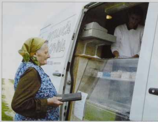
V Būdince vsakši drugi den pripelajo friški krū.

• Kak vidite, zdaj je baukše ali prvin, gda ste mladi bili?