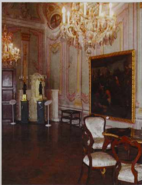
Skuruk vsikšomi, steri pride v muzeji, se najbola vidi baročna dvorana.

Za svoj rojstni den se vsefele pripravla. 18. maja je Svetovni den muzejov. V tom dnevi de den odprejti dveri muzeja, kcuj k tomi pa muzej nutpokaže svoj nouvi Zbornik, v sterom de dosta nouvoga nut spisano od naše krajine, od naše zgodovine. Dva dni kasnej pa gore oprejo nouvo raz-stavo v svojoj galeriji, pa do meli malo zabavo tō. Vej pa petdeseti rojstni den je nej vsikši den pa vsikšo leto tō nej. Te pa, naj ti bou na zdravdje pa eške na