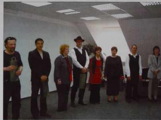
Mentorji in domanje učiteljice.