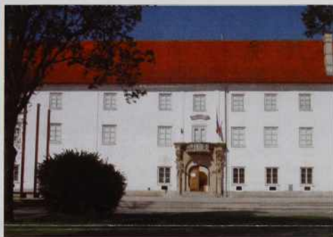
V soboškom gradi je že 50 lejt doma muzej.

Kulturnozgodovinski spomin trbej varovati in o njem pripovedavati. Ranč sobočki muzej je tej, steri veliko brigo pa skrb ma, ka se tej spomin na lidi pred nami, na njihov žitek, na njihove šege pa na njihovo delo ta ne pozabi. Že menje sobočkoga muzeja Pokrajinski muzej Murska Sobota guči od toga, ka se lidge, steri delajo v njem, spiščavlejo v minoula lejta zgodovine (zgodovina je zato, ka se je nika že zgodilo) cejle krajine pri reki Muri, pa včasih poglednejo v Porabje tō.