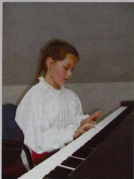
Flajnsni prsti na klavirju.

tak, ka ranč vpamet ne vze-mejo. Ništérni člani predse-dstva so se bojali, ka de tau trno dosta koštalo (pautni štóški, honorarji) pa te za