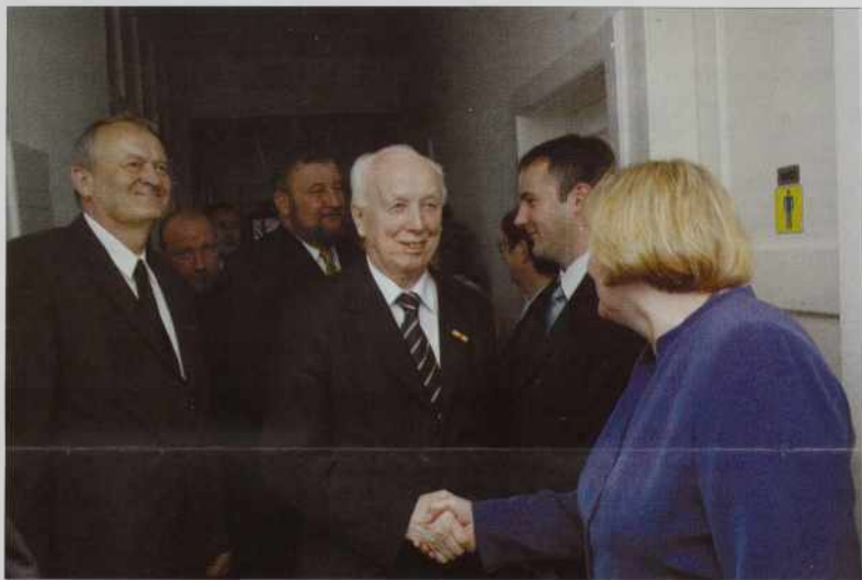
Predsednik Ferenc Mádl med prekmurskimi Madžari

Madžarski predsednik se je za pol ure udeležil tudi dobro obiskane slovensko-madžarske poslovne konference v lendavskem hotelu Elizabeta. Podatki kažejo, da se blagovna menjava med državama krepi in je v lanskih devetih mesecih bilo za 722 milijonov evrov, kar pomeni, da se državi približujeta sedaj postavljenemu cilju – milijardi evrov v obe smeri. Za zdaj je neugodno razmerje za Slovenijo, ki uvaža iz Madžarske dvakrat več kot izvozi. Skromne so tudi skupne naložbe, ki se gibljejo okoli 10 do 15 milijonov dolarjev, medtem ko so Madžari lani v posle na Hrvaškem vložili kar 750 milijonov dolarjev. Ferenc Mádl je gospodarstvenikom povedal, da kaže bolj izkoristiti posebnosti regije in si prizadevati za krepitev čezmejnega sodelovanja: »Dvojezičnost je vrednota tudi pri gospodarskem razvoju in sodelovanju,« kar pomeni vključiti tudi jezikovno znanje prekmurskih Madžarov in Porabskih Slovencev.