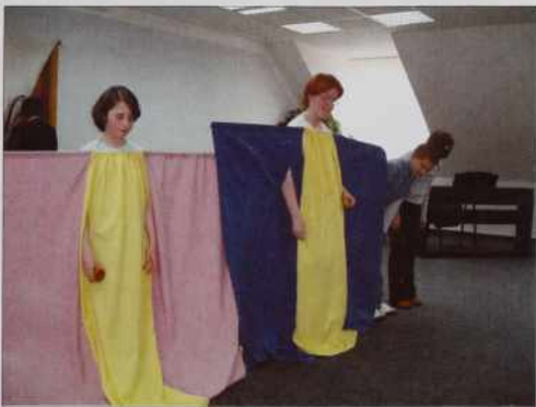
Princesa Garandesa v izvedbi seničkih lutkarjev