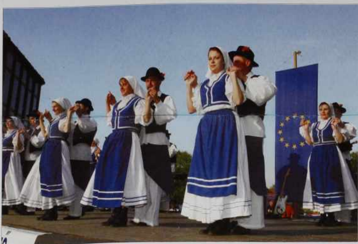
Na monoštrski prireditvi ob 1. obletnici vstopa v Eu so nastopili tudi seniški folkloristi in ansambel iz Kuzme.

Dapa pojmo po vrstli! Ka vse smo v Porabji vüпали od člans-tva? Najprva tau, ka nede več granic. Dapa vujznili smo se kak Talanin pes, steri je mislo, ka žujco gej, pa je smak samo led lizo. Granice so ostale, en čas mo je še prestapali, če rejšen je kontrola več nej tak sigurna, kak je bila pred vstopom, ka o stari časaj sploj ne gučimo. Na granici se trbej samo gnauk staviti, kak če bi mejni policisti, graničarji to bole prijznili bili, več ne spittavajo, kama demo pa zakoj. Mejni prehodi so malo duže oprejt, istina, ka se je tistoga ipa dosta trbelo trgati tak z Madžari kak s Slovenci, naj notprevidijo, ka je tau niksi prehod nej, steri večer v šestoj vöri zapira. Vseeno nam je Unija prinesla malo več svohode (gibanja). Dapa