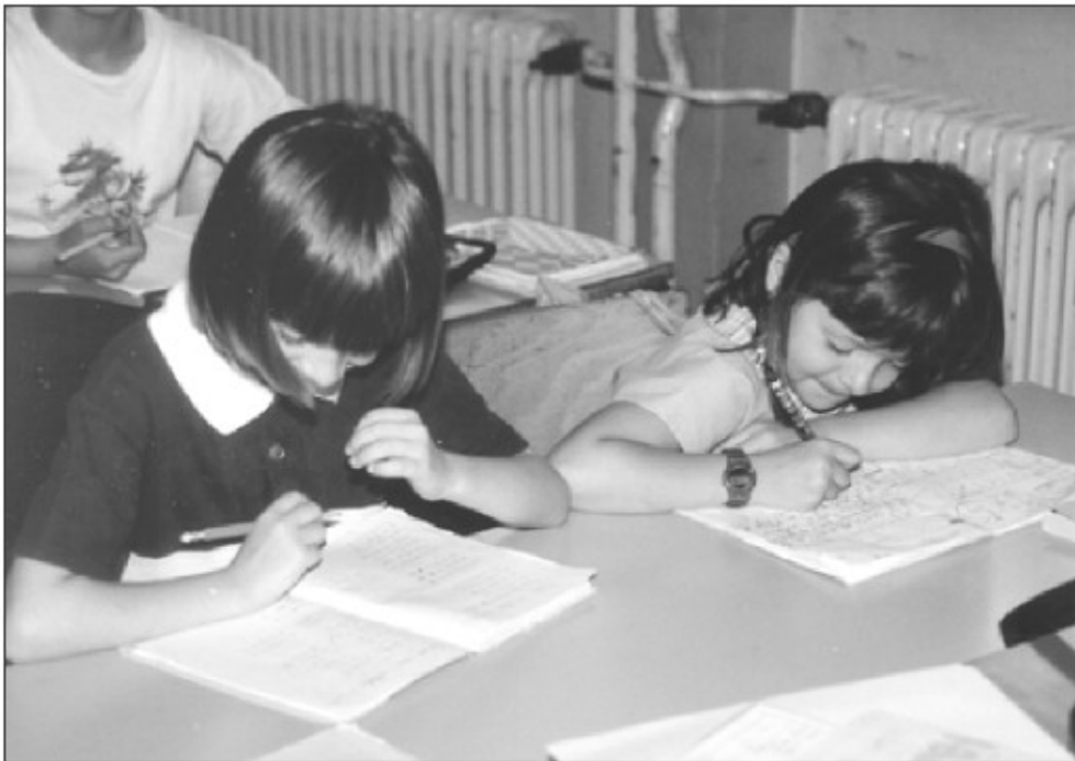
Prvi razred begunske šole O. Š. Jože Moškrič, Ljubljana 1993. Fotografija, ki je obšla svet.

Njeno stališče je bilo, da je bila otrokom, ki so prišli skupaj z materami iz Bosne in Hercegovine v Slovenijo odvzeta pravica do izobraževanja. Kot je bilo omenjeno, so se takrat predstavniki obeh držav, Slovenije ter Bosne in Hercegovine dogovorili za pomoč Slovenije pri izobraževanju begunskih otrok. V istem času je problem preučeval tudi UNESCO, ko se je pripravljala na vključitev v reševanje potreb begunskih otrok po izobraževanju. Slovenijo in Osnovno šolo Cirila Kosmača v Piranu je obiskala prva UNESCO-va ekspertna skupina; pogovarjala se je s pedagoškimi delavci in preučevala pripravljenost za pomoč beguncem. Čez štiri mesece je sledila druga ekspertna skupina. Izvedla je še tridnevni seminar za predstavnike slovenskih in begunskih šol v Sloveniji. Pri njih je zaživela še ena šola, to je Šola prijateljstva Bosne in Hercegovine – begunska šola. Obe šoli sta pripravili smernice za delo v obliki dveh dokumentov: