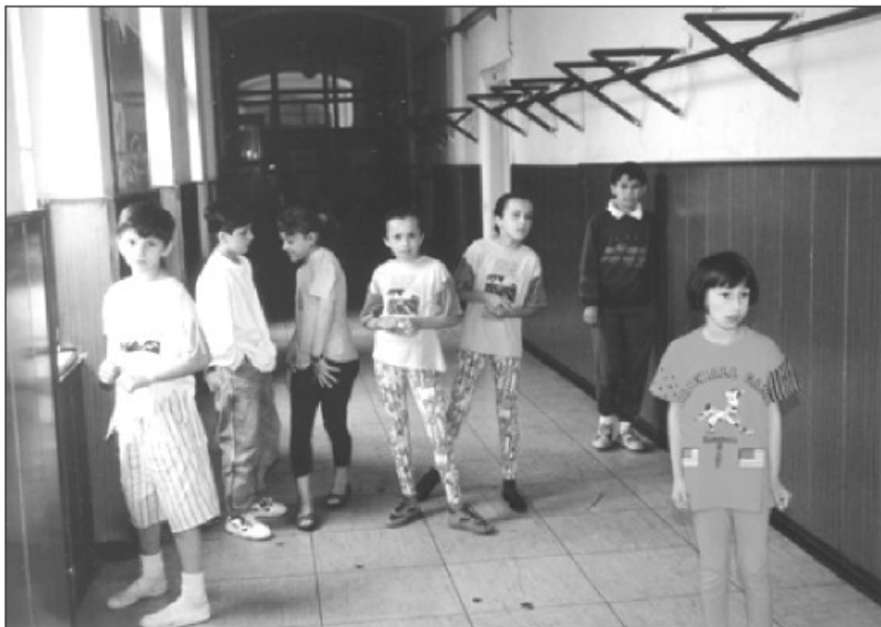
Učenci begunske šole na šolskem hodniku v zbirnem centru na Roški cesti v Ljubljani, leta 1993.

9000 otrok; poučevalo je 450 učiteljev. Manjše število begunskih otrok pa je vstopilo tudi v slovenske šole. To so bili predvsem otroci intelektualcev in otroci, ki so pristali kot begunci v majhnih krajih, v katerih zaradi manjšega števila otrok ni bilo organiziranih "bosanskih" šol. 8 Mreža šol v taki obliki je delovala do leta 1995 9 , ko so se begunski otroci začeli vpisovati v slovenske šole. Ohranile so se fotografije, dokumenti in spomini, ki so jih napisali begunski otroci in v katerih pretresljivo opisujejo svoje občutke. Po letu 1991 so javne ustanove in humanitarne organizacije skrbele za osnovne življenjske potrebe beguncev (kot so nastanitev, hrana, šola ...); nesebično je priskočilo na pomoč tudi veliko ljudi – prostovoljcev posameznikov, nevladnih organizacij. Ljudem, predvsem pa otrokom, so skušali olajšati bivanje v zbirnih centrih. Pomagali so jim na kulturnem in duhovnem področju, organizirali razne ustvarjalne delavnice, tabore, gledališke in lutkovne predstave, koncerte, jezikovne šole, svetovanja itd. Brez njih bi bilo življenje beguncev še bolj osamljeno