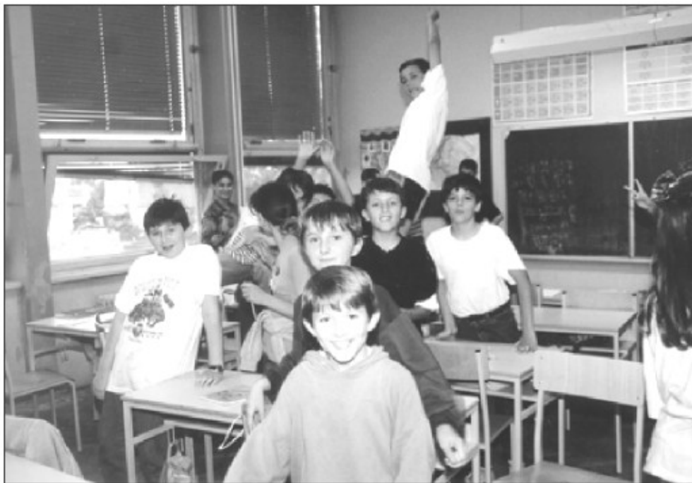
Učenci begunske šole O. Š. Jože Moškrič med odmorom, Ljubljana 1993.

Otroci so v zgodnji mladosti še posebno občutljivi. Iz pogovorov s starši begunci iz Bosne in Hercegovine je razvidno, da so otroci izkazali svojo stisko predvsem z večjo odvisnostjo od staršev, povečanim strahom, nazadovanjem na nižjo stopnjo vedenja, motnjami spanja, povečano agresivnostjo in jokavostjo, reakcijami strahu ob nenadnih zvokih ipd. Šola je bila zato za te otroke izjemno zdravilna. Že nekaj tednov po začetku šole so se otroci umirili. V takih okoliščinah je bila osnovna šola (z bosansko-hercegovskim učnim programom) organizirana institucija, ki je bila enaka tisti v predvojnem življenju, nekakšen most med preteklostjo in sedanjostjo. Šola je poskrbela za to, da so otroci ohranili vloge iz predvojnega življenja, strukturirala je njihov čas, obenem pa so otroci zaradi šolskih dejavnosti, učenja, druženja s sošolci in posebne skrbi učiteljev uspešneje premagovali travme vojne in begunskega življenja. Z obiskovanjem osnovnošolskega programa v materinem jeziku je bilo upoštevano tudi že omenjeno priporočilo UNHCR-ja, ki tudi pravi, da mora biti izobraževanje beguncem dostopno, kakovostno in ustrezno.