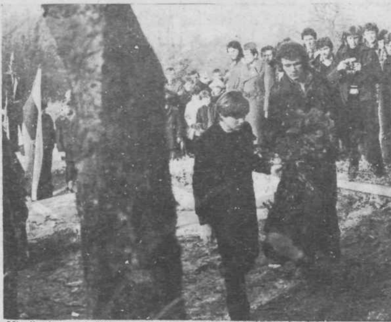
Mladinci so položili venec k spomeniku padlih borcev.

okolici. Pravočasno so še uspeli umakniti ranjence na varno, borci pa so s sovražnikom sprejeli krvavi ples, kot je dejal tovariš Oki. V tej bitki s premočnim sovražnikom je padlo približno sto partizanov, precej je bilo ranjenih.