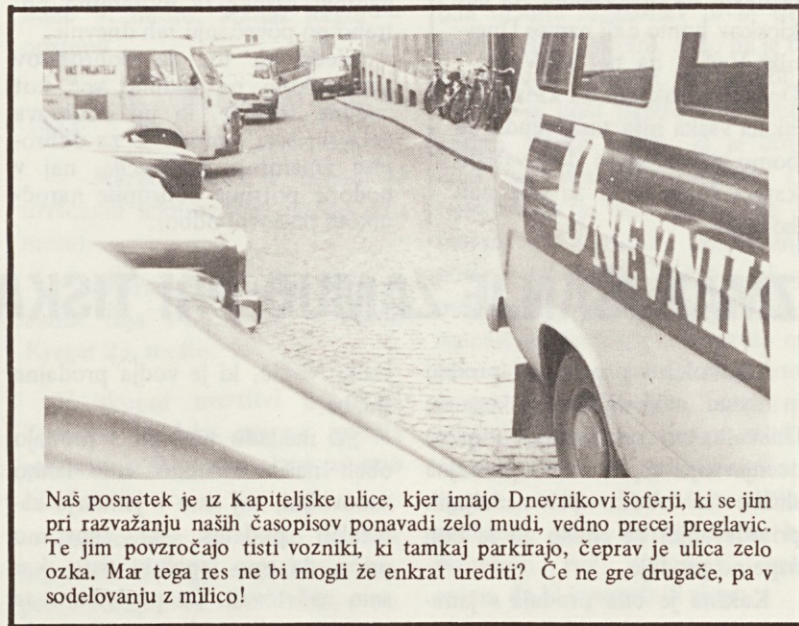
Naš posnetek je iz Kapiteljske ulice, kjer imajo Dnevnikovi šoferji, ki se jim pri razvažanju naših časopisov ponavadi zelo mudi, vedno precej preglavic. Te jim povzročajo tisti vozniki, ki tamkaj parkirajo, čeprav je ulica zelo ozka. Mar tega res ne bi mogli že enkrat urediti? Če ne gre drugače, pa v sodelovanju z milico!