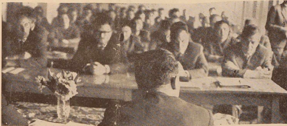
V ponedeljek so se sešli k prvim sejam odborniki novoizvoljenih občinskih skupščin

Močnejši ali trajen dež z ohladitvijo pričakujemo okoli 8. in 12. junija. V ostalem delno do pretežno sončno, a v splošnem nestalno vreme s pogostimi krajevnimi nevihtami.