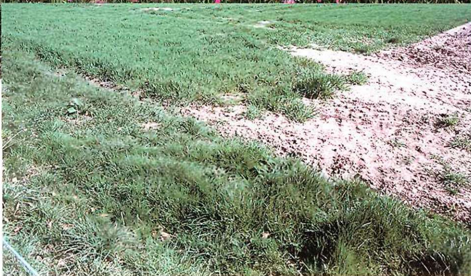
Cvetoč travnik pod Slivnico

Povprečna njiva v Angliji ima 150 ha in nima nobenih neobdelanih robov ali grmovnih omejkov