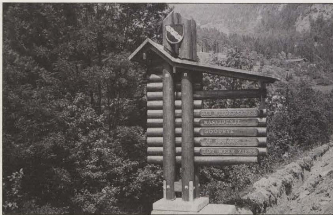
Turistična tabla je petjezična. Se bo občina turistom kdaj predstavila tudi kot dvojezična?

Kartografska ustanova freytag & berndt je izdala dve novi karti, od katerih prva nudi pregled možnih sprehajalnih rut v predelu skupine Kreuzeck – Melska dolina, druga pa na področjih Julijskih Alp. Gre za znano kvaliteto delo, ki poleg zemljevida nudi celo vrsto dodatnih informacij: vrisane so planinske postojanke, navedeni naslovi turističnih informacijskih birojev, hkrati pa so pri f&b poskrbeli tudi za pravilno označbo posameznih vrhov in krajev, torej za poimenovanje in pisavo posameznih krajev in vrhov ob tromeji med Koroško, Slovenijo in Furlanijo-Julijsko krajino.