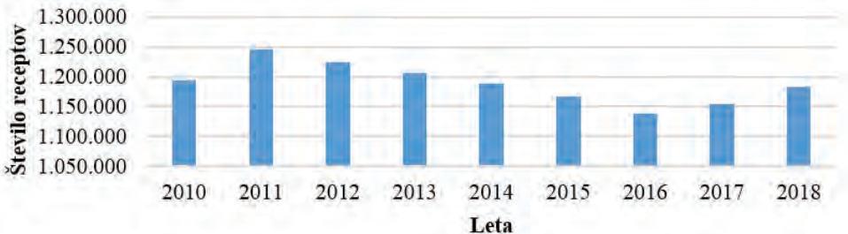
Slika 1: Število receptov, izdanih za zdravila iz ATC-skupine M, med letoma 2010 in 2018

Število receptov, izdanih za zdravila, ki se večinoma uporabljajo za zdravljenje bolezni mišično-skeletnega sistema in vezivnega tkiva (zdravila iz farmakoloških skupin M01A – zdravila s protivnetnim in protirevmatičnim učinkom, M03B – mišični relaksanti s centralnim delovanjem, M04A – zdravila za zdravljenje protina, M05B – zdravila z učinkom na strukturo in mineralizacijo kosti in M09A – druga zdravila za zdravljenje motenj mišično-skeletnega sistema), se je v obdobju med letoma 2010 in 2018 nekoliko znižalo (slika 1). V letu 2018 je bilo izdanih približno 1,2 milijona receptov v vrednosti skoraj 17,4 milijona EUR. Od posameznih farmakoloških skupin je bilo največ receptov izdanih za zdravila iz skupine nesteroidnih protivnetnih in protirevmatičnih zdravil (M01); število receptov se je med letoma 2010 in 2018 nekoliko znižalo. Glede predpisovanja so na drugem in tretjem mestu zdravila za bolezni kosti (M05), pri katerih je število receptov med leti 2010 in 2018 prav tako upadlo, ter zdravila za zdravljenje protina (M04), pri katerih pa se je število receptov iz leta v leto povečevalo (tabela 1) (ZZZS, 2021).