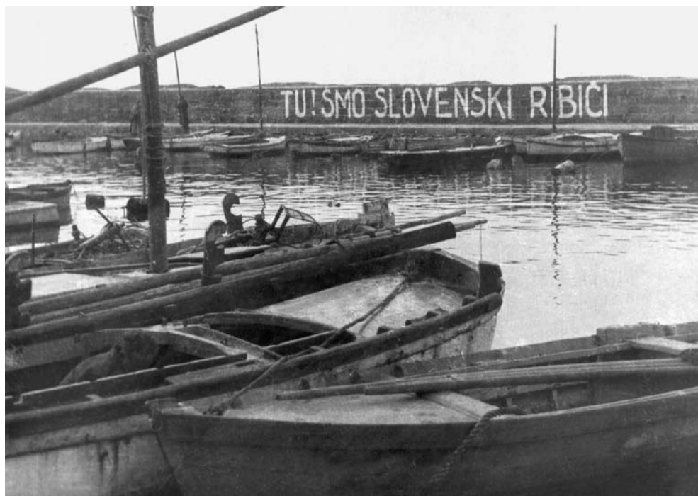
Slika 5: Kantovlje, spomladi 1946.

komisija ustanovljena in da so pripravili tudi inštrukcije za njeno delo. 7. marca je prišla v Trst in 26. marca v Gorico, kjer je ostala do začetka aprila, nakar je zapustila »sporno« ozemlje. Osnovna naloga komisije je bila pripraviti poročilo in rakomandacijo o določitvi meje med Italijo in Jugoslavijo, ki naj bi bila v glavnem etnična in bi puščala minimalno Slovencev in Hrvatov pod Italijo in minimalno število Italijanov pod Jugoslavijo, v kar naj bi se prepričala ob nenapovedanih obiskih po vaseh in mestih na »spornem« območju. Ob tem naj bi komisija upoštevala tudi ekonomske in geografske značilnosti tega ozemlja. Tudi dejansko je preučila množico dokumentov, ki sta ji predložili italijanska in jugoslovanska diplomacija, opravila veliko terenskih raziskav in obiskala precej krajev, kjer se je pogovarjala z ljudmi. Vsa ta opažanja in ugotovitve naj bi združila v enotni predlog za razmejitve, do katerega pa zaradi različnih interesov posameznih članov komisije ni prišlo in tako je komisija podala svetu zunanjih ministrov, ki so poleti 1946 zasedali na mirovni konferenci v Parizu, štiri različne razmejitvene predloge.