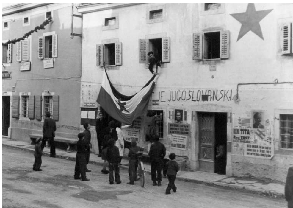
Slika 4: Okraševanje hiš pred prihodom mednarodne razmejčitvene komisije (Fototeka Oddelka za zgodovino Narodne in študijske knjižnice v Trstu, fond ZVU).

ZRNO LETOŠNJEGA PRIDELKA OKUPATORJU! SMRT BELI GARDI! SMRT NEMŠKIM HLAPEM! SMRT IZDAJALCEM! VSI V NARODNO OSVOBODILNO VOJSKO! Zavedajte se, da so napisne akcije velikega pomena pri našem političnem delu.« 52