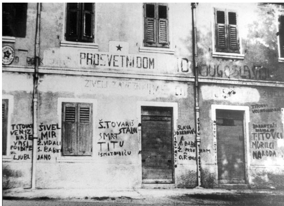
Slika 7: Politično-propagandni napisi in grafiti po Informbiroju. Dolina, poleti 1948 (Fototeka Oddelka za zgodovino Narodne in študijske knjižnice v Trstu, fond ZVU).