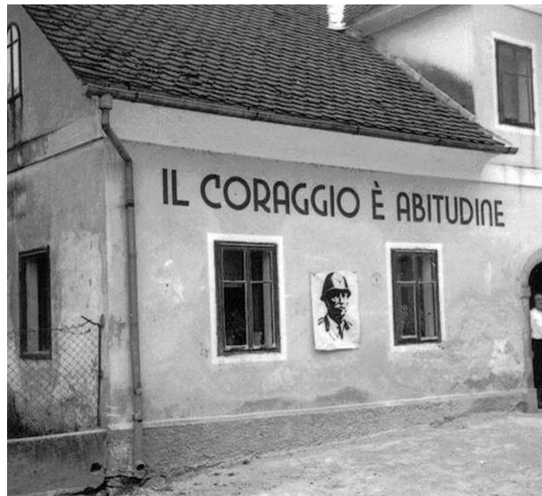
Slika 1: Fašistični politično-propagandni napis.

Podobne težave s takimi napisi je imela tudi avstrijska manjšina na južnem Tirolskem. 8 Zanimivo pa je, da fašističnih uradnikov niso motili napisi v češčini, ki so jih na menjalnice, slaščičarne, prodajalne sladolediv in delavske zadruge namestili češki priseljenci oziroma delavci v Gradežu. 9