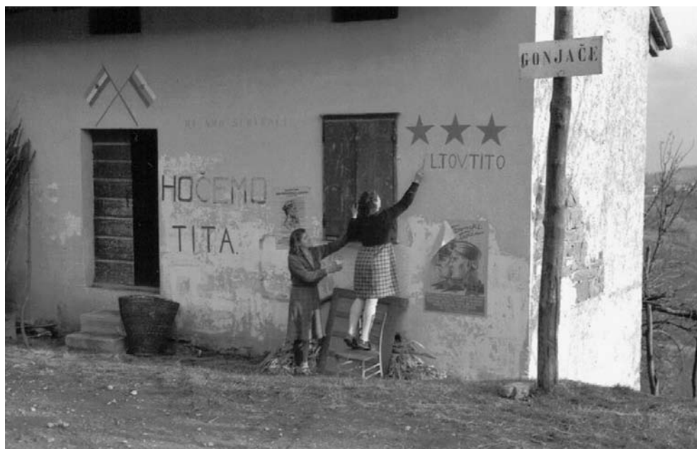
Slika 3: Mladinke na napisni akciji. Gonjače, februar 1946.

komunisti, ki so med leti 1926-1935 delovali zunaj slovenskega narodnega gibanja. Tako so slovenski komunisti pisali grafito tudi na 1. maj, za katerega je bilo pod fašizmom prepovedano praznovanje. Ob 1. maju 1933 so se pojavile množične akcije povsod na Primorskem pa tudi drugod po Sloveniji. Predvsem je bilo številno trosenje letakov in pisanje grafitov. Parole so bile: Živeli sovjeti v Italiji; Za svobodo narodnih manjšin; Za slovensko-hrvatske sovjete , podpisan pa je bil »Komunistični oddelek Julijske krajine«. Spet so se množično pojavili tudi napisi na objektih na ilirskobistriškem, pa tudi na vratih in grobovih fašističnih aktivistov, na katerih je pisalo: Smrt – bo plačilo izdajalcem . 32