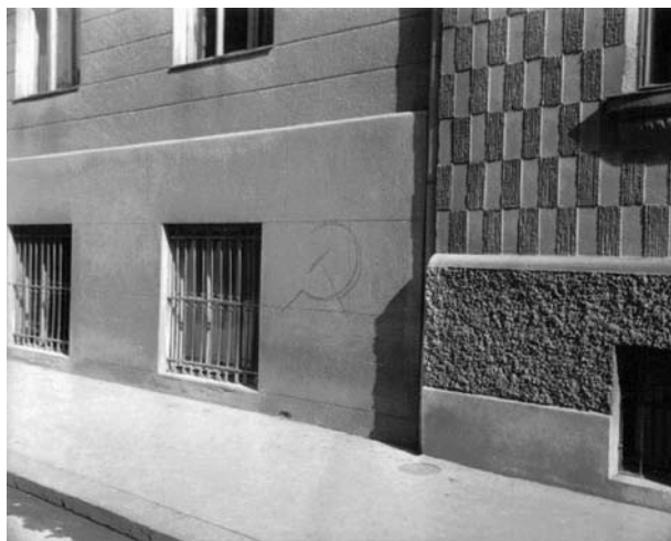
Slika 2: Medvojni grafit iz Ljubljane (Fototeka Muzeja novejšje zgodovine v Ljubljani, fond 360-12).

morajo izginiti vsi napisi v tujem jeziku, zato so mestni in krajevni NOO-OF odbori odgovorni, da se ta sramota odstrani in to temeljito. Mestni-krajevni NOO-OF odbori naj po svojih organih pregledajo prav vse javne in zasebne stavbe in prostore ter poskrbe za odstranitev vseh tujih in ostalih napisov, ki niso v skladu z našo narodnoosvobodilno borbo«. 18