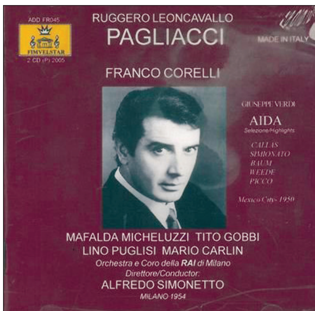
Mario Carlin kao protagonist u operama „I Pagliacci“ (R. Leoncavallo) i „Aida“ (G. Verdi), fotografija omota ploče iz 1954. god. Mario Carlin as protagonist in the operas „I Pagliacci“ (R. Leoncavallo) and „Aida“ (G. Verdi), photography of the album cover from 1954

Do konačnog pripojenja Hrvatskoj, odnosno Jugoslaviji, u povijesni su hodogram Pule u prvoj polovini 20. stoljeća tragove ostavili brojni vladari i vlasti – Austro-Ugarska Monarhija, fašistička Italija, njemačka okupacija i anglo-američka vojna uprava. Mijene državnih sustava urodile su i izgradnjom pluralnog kulturnog prostora u kojem je glazba, kao jedan od temelja artikulacije urbanog identiteta grada, imala veliku ulogu.