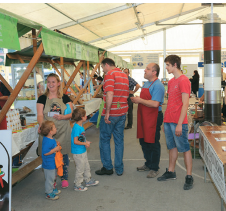
Utrinek z lanske prireditve

Zagotovljena je mednarodna udeležba podjetnikov iz Avstrije in Italije, pod okriljem naših dveh stanovskih podjetniških podpornih organizacij – Slovenskega deželnega gospodarskega združenja iz Trsta in Slovenske gospodarske zveze iz Celovca.