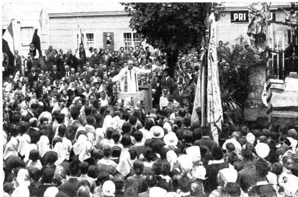
Pisatelj Franc Sal. Finžgar govori na Mestnem trgu ob prosvetnem dnevu 23. avgusta 1931

V noči od 11. na 12. 2. 1933 so bili v Gradacu in Podzemlju razširjeni hujskajoči letaki protidržavne vsebine ter je z lastnimi priznanji dokazano, da so razširjevalci prejeli te letake od Prosvetnega društva v Metliki.