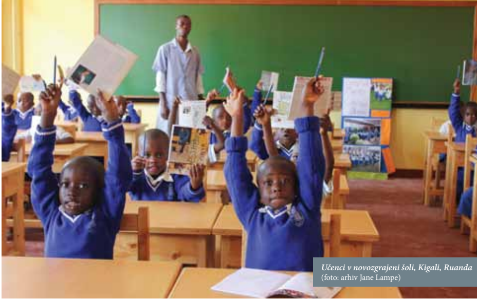
Učenci v novozgrajeni šoli, Kigali, Ruanda

V zadnjih dvanajstih letih nam je na Slovenski karitas ob dobroti Slovencev s pomočjo akcije Za srce Afrike ter ob sofinanciranju Ministrstva za zunanje zadeve RS in Misijonskega središča na misijonih v Ruandi in Burundiju uspelo zgraditi ali obnoviti in opremiti 1 vrtec, 6 osnovnih šol in 1 srednjo šolo. Misijonarji ob tem skušajo zagotoviti revnim otrokom dobre učitelje in učinkovito osnovno šolanje v razredih, ki niso prenatrpani. Šolnine so simbolične ali pa jih starši povrnejo s svojim delom na misijonu. Na misijonskih osnovnih šolah otrokom zagotovijo tudi dnevni obrok, česar v javnih šolah ni. Vsi pa vemo, da se je brez hrane zelo težko učiti. Mnogi misijoni imajo tudi vrtce, da tako otroci dobijo predznanje in dobro vzgojo že pred vstopom v šolo in niso prepuščeni samim sebi, ko njihovi starši delajo na polju. Zelo pomembne so tudi srednje šole. V Afriki je namreč malo mladih, ki lahko obiskujejo srednjo šolo in s tem pridejo do poklica, da bi se lahko izkopal iz revščine in imeli lepšo prihodnost. Sledita dva primera projektov dobre prakse v povezavi s šolstvom v Afriki, ki ju je podprla Slovenska karitas.