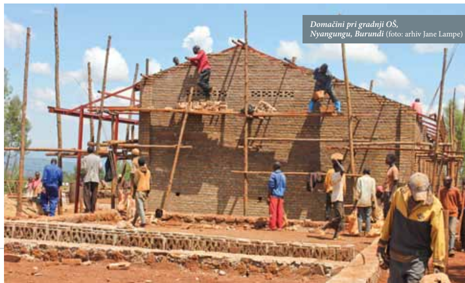
Domačini pri gradnji OŠ, Nyangungu, Burundi

sati. Včasih tudi učitelj ne pozna imen vseh svojih učencev. Mladim je dobra izobrazba dostopna le v zasebnih šolah, ki si jih zaradi visokih šolnin lahko privoščijo samo bogatejši. Otroci so pogosto tudi odsotni iz šole, ker morajo doma pomagati v gospodinjstvu; še posebej dekleta s prinašanjem vode, čiščenjem hiše, delom na polju. Odsotni so tudi zaradi bolezni, kot so malarija, diareja, ali pa zaradi hude podhranjenosti, ki lahko pusti otrokom posledice v razvoju za celo življenje. Mnogi starši otrokom zaradi hude revščine ne morejo plačati šolnine ali kupiti obvezne uniforme, zato sploh ne obiskujejo šole. Včasih morajo družine zaradi konflikta ali hudih posledic podnebnih sprememb zapustiti svoj dom in se seliti v druge kraje ali države, kjer imajo otroci zopet manj možnosti za izobraževanje. Na Slovenski karitas zato skupaj z misijonarji posvečamo veliko pozornost podpori šolstva v Afriki, hkrati pa tudi omogočanju možnosti za delo in plačilo staršem, da lahko otrokom omogočijo preživetje in šolanje.