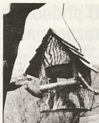
Janeževa ptičja krmilnica