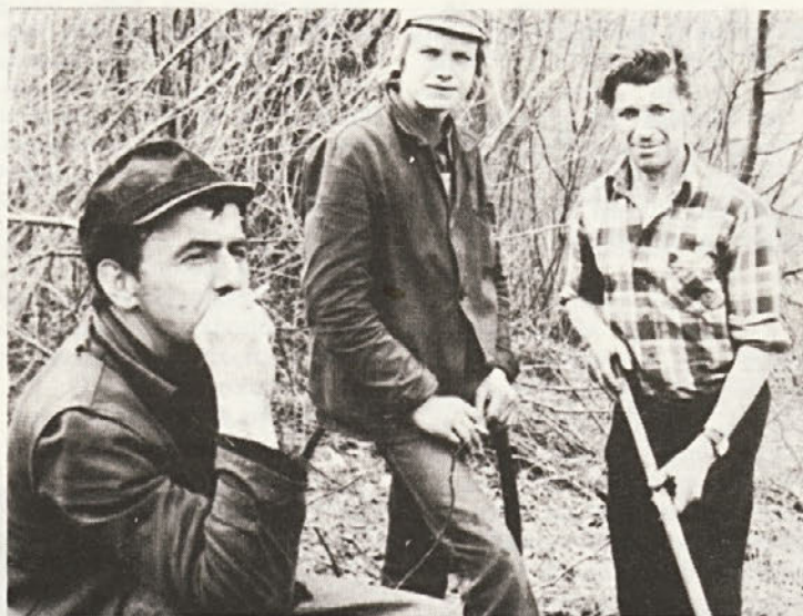
Skupina delavcev pri pripravi tal za pogoždovanje med oddihom