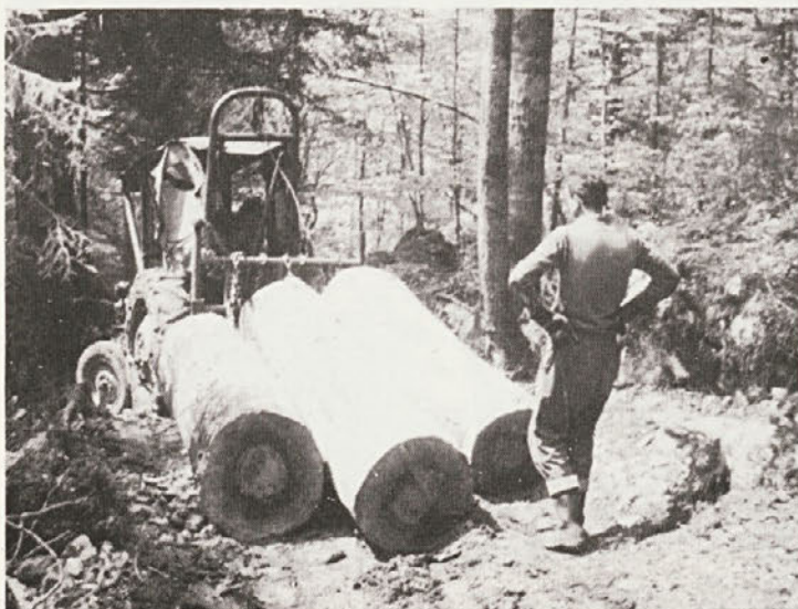
Traktor Ferguson 35, opremljen s traktorskim vitlom in z nosilnim jarmom, ki so ga izdelali v Agroservis Šempeter v Savinjski dolini (Brezova reber odd. 24 d, l. 1964).