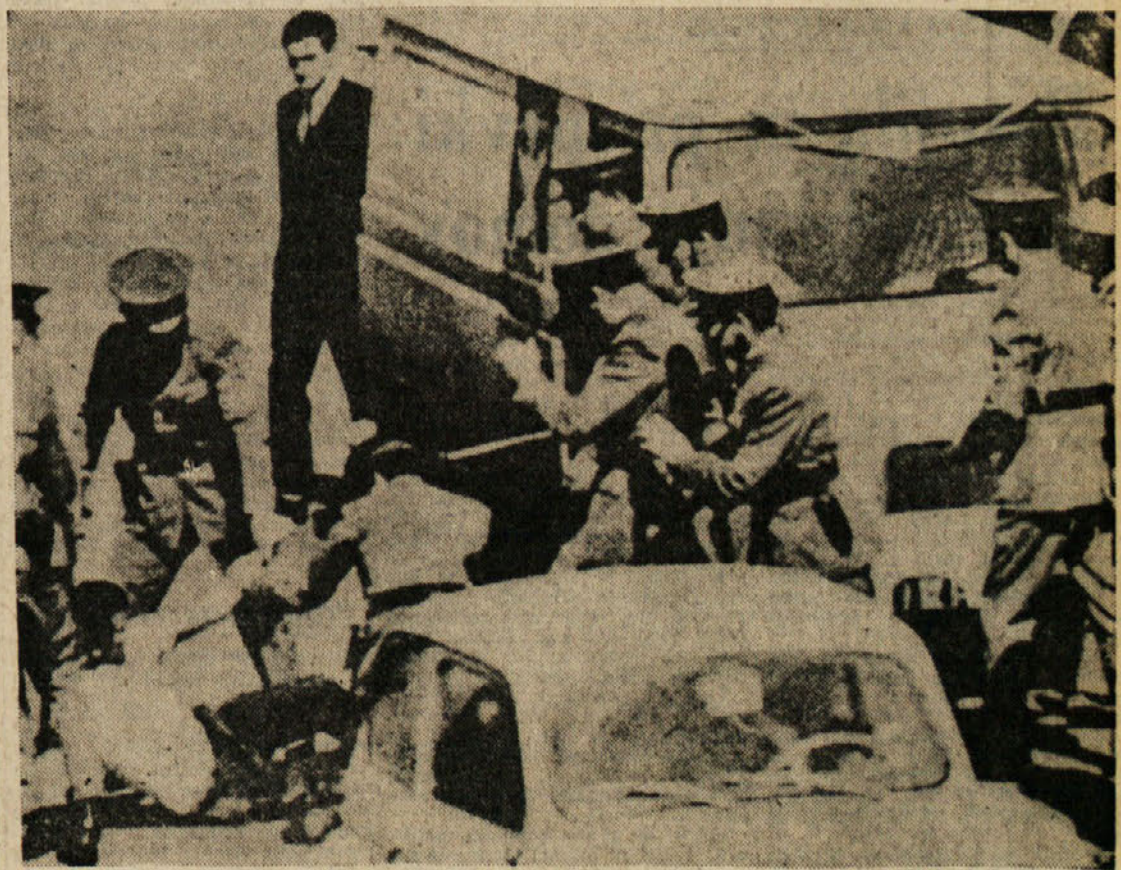
Francovi policaji prepeajo študenta med nedavnimi demonstracijami v Barceloni