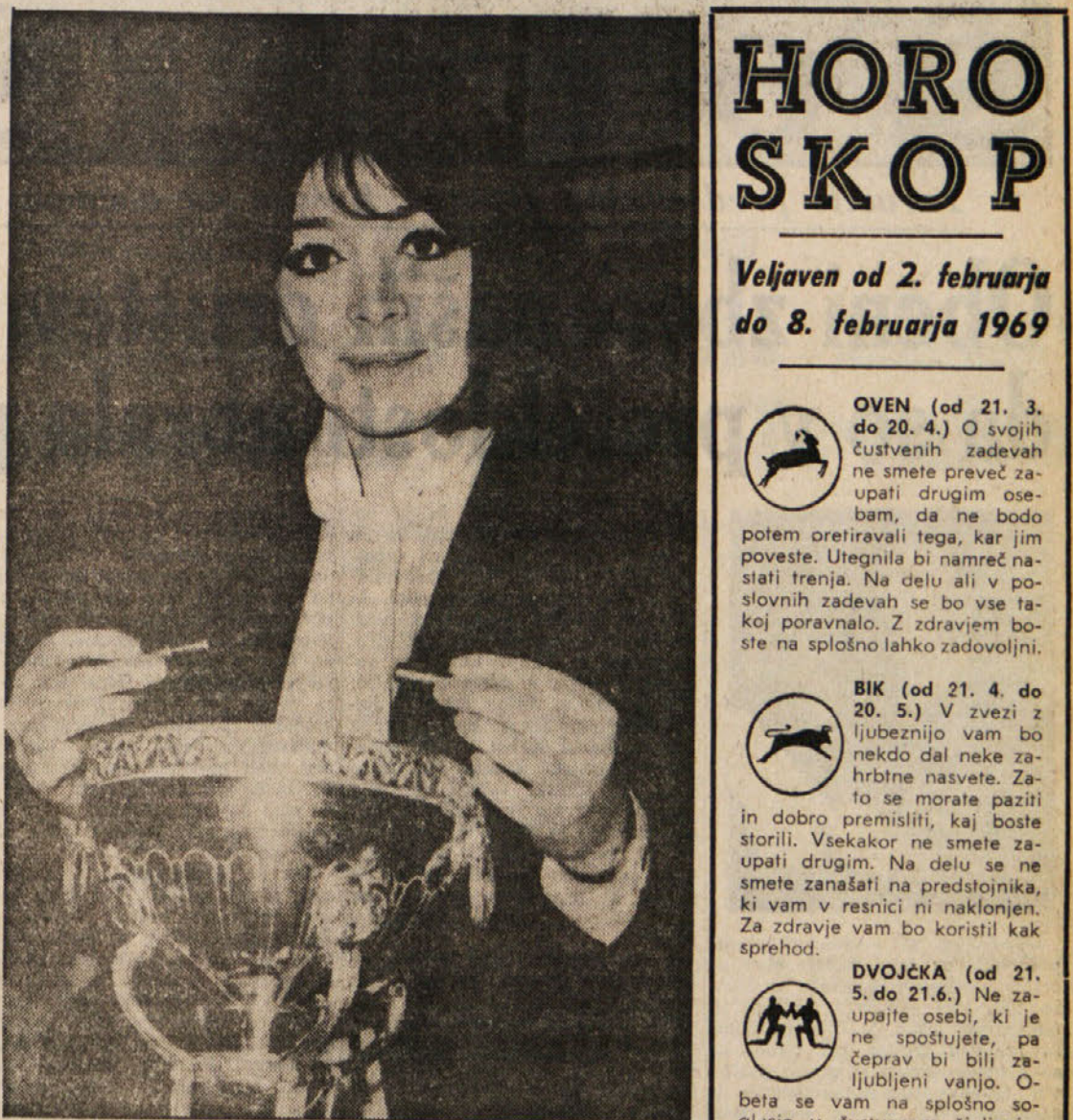
Mary Hopkin, ki je zelo uspešno nastopila na letošnjem festivalu v Sanremu