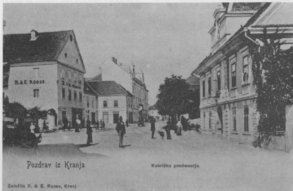
Pozdrav iz Kranja

Kokrško predmestje