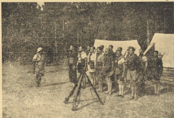
Plinske moske . . .

Smo za mir! Nočemo vojne! Ni še dolgo tega, ko smo čitali o predlogih za mednarodno razorožitev. Govorimo o miroljubnosti držav. Da, miroljubnost ostaja pri nekaterih politikih le skromna, tiho izražena želja, hotenje bi rekel, med tem ko jim stvarnost neizprosno potiska v roke puško in natika na obraz plinsko masko.