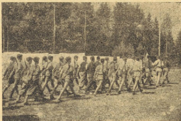
Taborniki se vračajo z daljšega pohoda

»Borili se bomo, ker je življenje borba in ker je v borbi edini smisel človeškega življenja.«