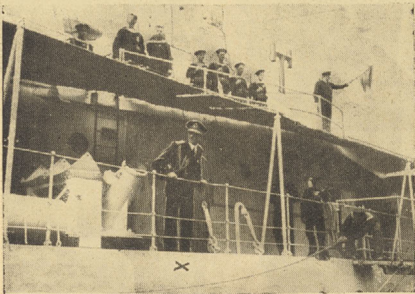
Poslednji pozdrav od domovine

Korakamo mimo krste, ki jo stražijo vojaški dostojanstveniki in Sokoli. Obložena je z venci in cvetjem. V prsih me stisne, ko stojim tako blizu Njega, najraje bi se vrgel na krsto, jo objel in izkričal svojo boleost. Toda ne, ni mogoče, ni časa, za mano stoje še deset-tisoči in deset-tisoči hrvatskih seljakov in seljakinj, ki bi radi videli Njega.